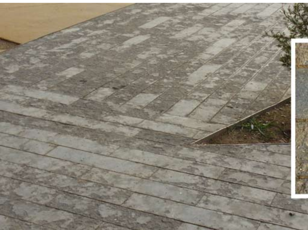
Figura 2. Material pétreo (caliza) con tendencia a la desplazación empleado como pavimento en plaza

Estas propiedades definirán su comportamiento frente a los usos a los que se destinen, frente al medio ambiente en el que se ubiquen y frente a las necesidades de mantenimiento. Por tanto, en el momento de seleccionar el material o los materiales que se van a utilizar, será necesario conocer y tener en cuenta determinados parámetros físicos, químicos, mecánicos y tecnológicos para entender su comportamiento frente al uso y para planificar las necesidades de mantenimiento; en esencia, para su diseño. Si estos aspectos no se tienen en cuenta la durabilidad de los materiales y del espacio se verá reducida (Figuras 2, 3 y 4).