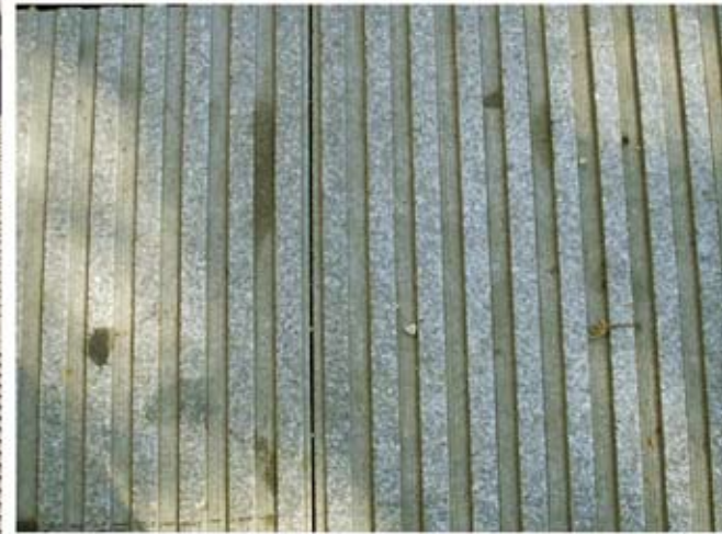
Figura 5. Diferentes texturas en pavimentos y zonas de circulación peatonal.

dientemente de su acabado superficial, y los efectos que las limpiezas más intensas puedan tener. Como se ha comentado, los pavimentos son uno de los casos más evidentes en los que se necesita acabados rugosos y normalmente están hechos con piezas o placas de materiales pétreos (naturales o artificiales) resistentes a la abrasión. Estas piezas se unen con cemento a la superficie que les sirve de soporte y se utilizan lechadas de cemento a su alrededor para sellar la entrada de agua. La porosidad y la resistencia de ambos materiales (pétreo y lechada) es sensiblemente diferente y las limpiezas más enérgicas (en este caso y dentro de las habitualmente empleadas por las brigadas de mantenimiento, agua a presión fría o caliente) suponen, a corto y medio plazo, una erosión de la junta. Esta zona de unión que rodea la pieza de material pétreo, tras sucesivas limpiezas, puede acabar desapareciendo, facilitando, a medio y largo plazo, la penetración del agua y la disolución del mortero de unión de las diferentes piezas con el sustrato en el que se apoyan (Figuras 6 y 7).