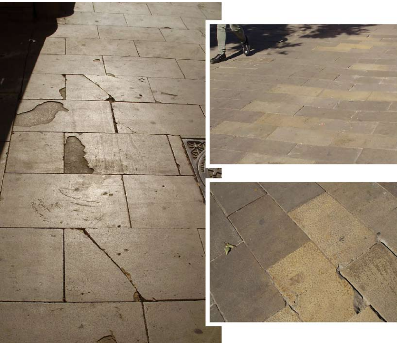
Figura 3. Material pétreo (caliza) con tendencia a la desplazación empleado como pavimento en área peatonal y de vehículos (en algunas zonas las placas de piedra se han sustituido por otras similares que aparecen fragmentadas). [En situaciones similares, ¿no sería más adecuado utilizar otro material de pavimentación?].