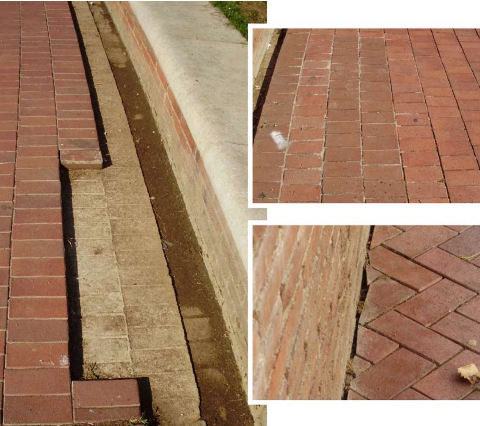
Figura 7. Pérdida de piezas de pavimento cerámico por separación con el mortero de unión y zonas reparadas.