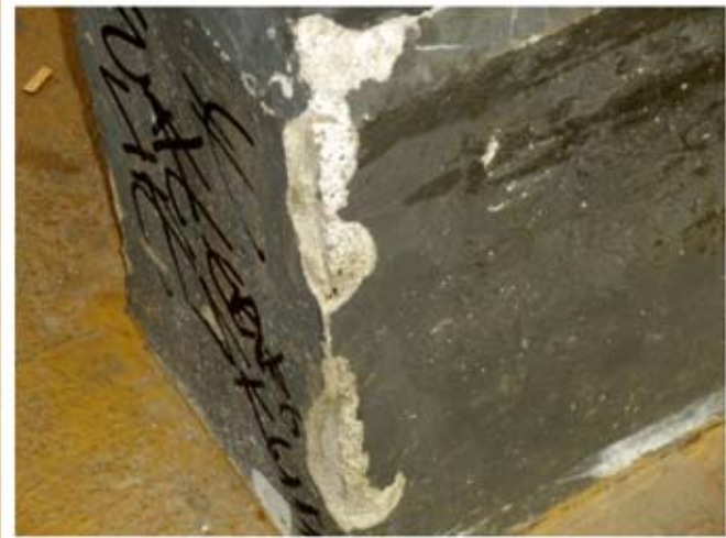
Figura 8. Banco de hormigón revestido con mortero y pintado en el que ha ido saltando la pintura y el revestimiento.