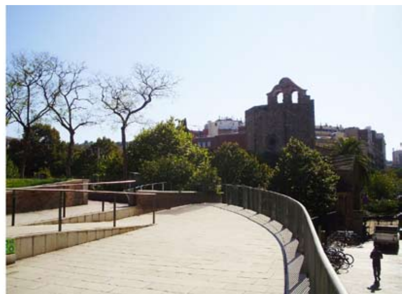
Figura 1. Jardins de Sant Pau del Camp (Barcelona). Según el punto de observación se pueden contemplar diferentes construcciones que documentan la evolución histórica de la zona y de la ciudad.