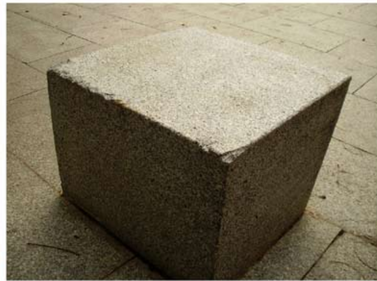
Figura 9. Fragmentaciones de aristas en banco de granito