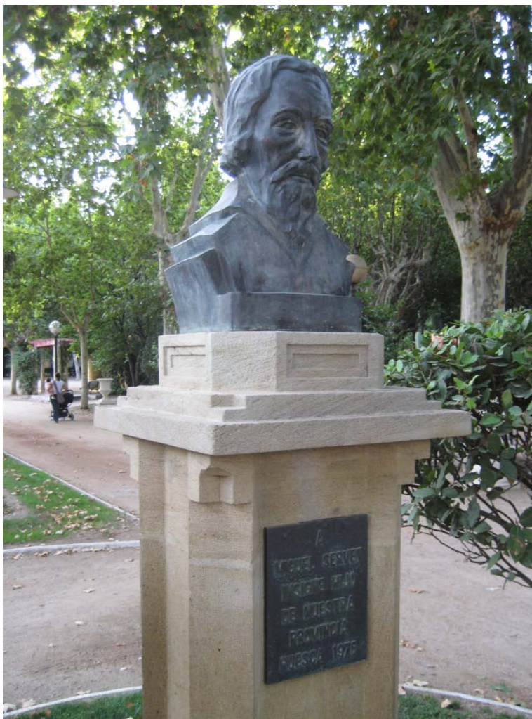
Busto a Miguel Servet en el parque de Huesca. Es una obra de bronce de Blanca Merchant de Caso.

Fuera del recinto del Parque Miguel Servet encontramos otras obras que, como las anteriores, también fueron promovidas durante este periodo. El problema de estos monumentos es que no se conserva casi documentación sobre su proceso ya que la administración pública, en ese momento, no requería de papeles. Los datos de estas obras se conservan en la memoria del personal del Ayuntamiento oscense que colaboró para que estos proyectos se llevaran a cabo.