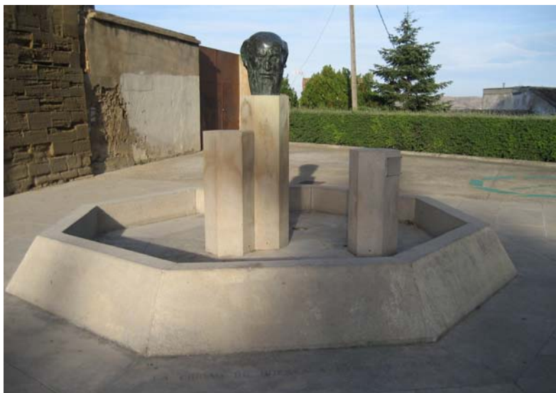
Busto de Ramón y Cajal situado en la Plaza de la Universidad. Obra realizada por Pablo Serrano.

un busto de Ramón y Cajal con destino al monumento que se proyectaba erigir en la ciudad de Huesca. Poco tiempo tardó el autor en modelar una vigorosa cabeza del famoso médico aragonés que fue entregada al Ayuntamiento oscense el 22 de julio de 1983. Si bien es cierto que la instalación del busto no se produjo hasta el 17 de octubre de 1984.