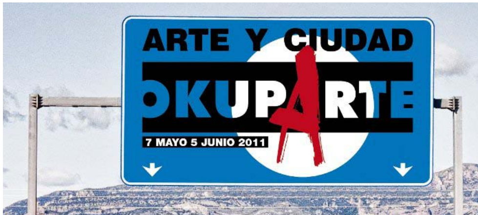
Cartel de Okuparte de Huesca en su 12ª edición en el año 2011.

últimas tendencias artísticas que se manifiesta eclécticamente en diferentes disciplinas como las artes plásticas, el audiovisual, el arte multimedia, el teatro, la danza o la música que muestran nuevas formas creativas y nuevos lenguajes a partir de interesantes herramientas.