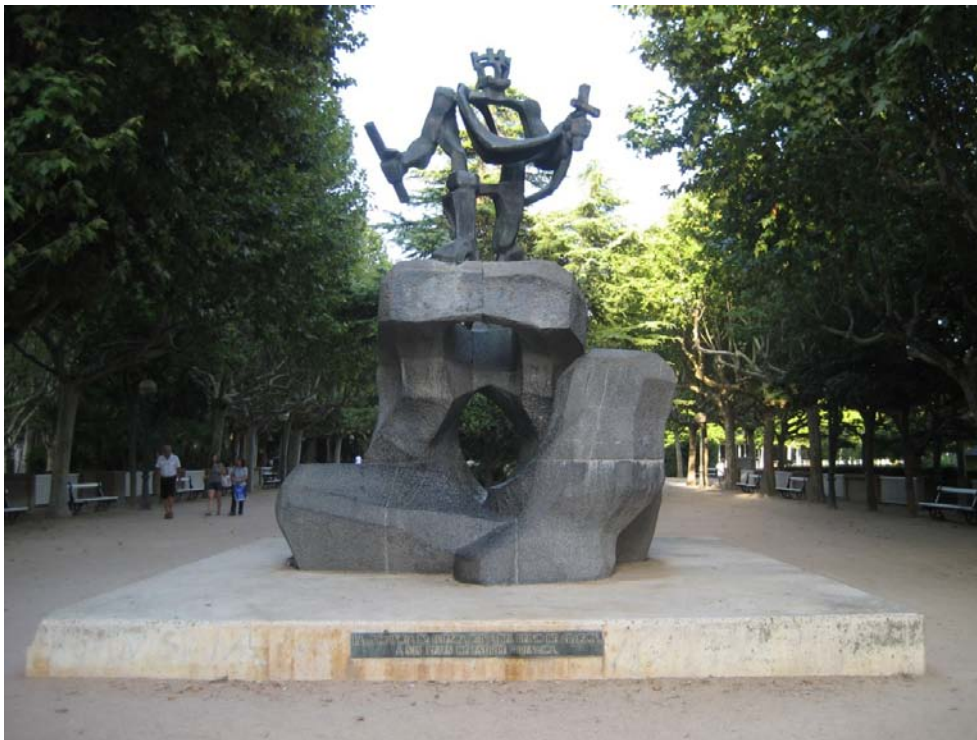
Monumento a los Reyes Aragoneses en el parque de Huesca ubicada en la entrada de la calle Juan XXIII. Es una obra de César Montaña.

abandonó la vida monástica para continuar la dinastía y dar origen a la Corona de Aragón.