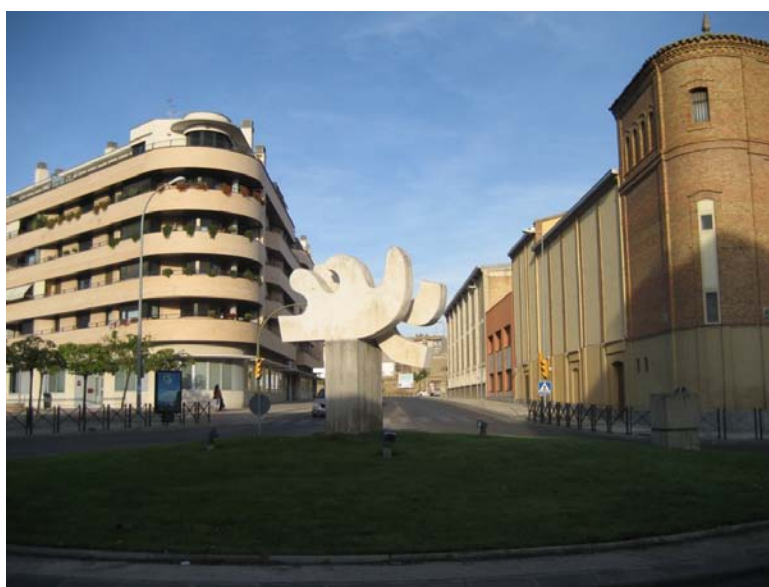
Monumento a Joaquín Costa en la confluencia de la Avenida Monreal y la Avenida de la Paz. La obra es Javier Sauras.

Por último, en la confluencia de la Avenida Monreal y la Avenida de la Paz se halla el Monumento a Joaquín Costa , homenaje de la capital oscense a este insigne personaje. La obra es Javier Sauras y es de piedra, hormigón armado y bronce midiendo 3,20 metros de altura. Fue realizada en 1983.