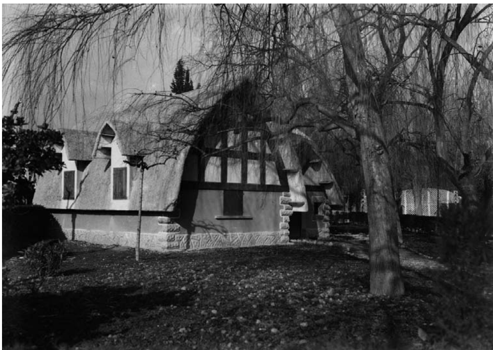
Imagen de la casita de Blancanieves del Parque Miguel Servet de Huesca en torno a 1975.