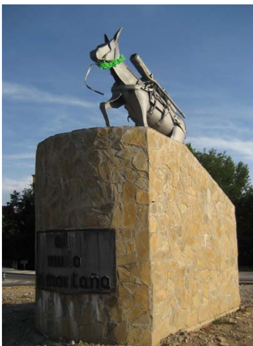
Monumento dedicado al mulo en la rotonda del puente de San Miguel.

Mucho más curioso es el Monumento al mulo 18 que fue que fue erigido por el Gobierno Militar en 1982. Es el único de estas características en todo el país, sin embargo, se puede vincular con otros similares que hay en países como Suiza, Francia e Italia. Pretende simbolizar la unión y cercanía entre el pueblo y las fuerzas armadas, razón por la cual fue donado por el Ejército a la ciudad en el año 1987. Anualmente, cada 28 de noviembre, el mulo recibe un homenaje que durante mucho tiempo organizó la Asociación de Militares Veteranos de Montaña y ahora lo lleva a cabo la Asociación Cultura Tradicional Altoaragonesa . Ambas ponen en valor la labor de uno de los animales que más ha ayudado al desarrollo de la provincia de Huesca durante varios siglos, resaltando el papel que este animal tuvo en las labores de las unidades de montaña. En octubre de 2009, el monumento al mulo tuvo un cambio de ubicación debido a que en el paseo Lucas Mallada se desarrollaron obras de prolongación y la construcción de una rotonda para el tráfico que obligó a moverlo de su emplazamiento original junto al puente de San Miguel. En cualquier caso, la obra se ha reubicado a tan sólo unos pocos metros de distancia.