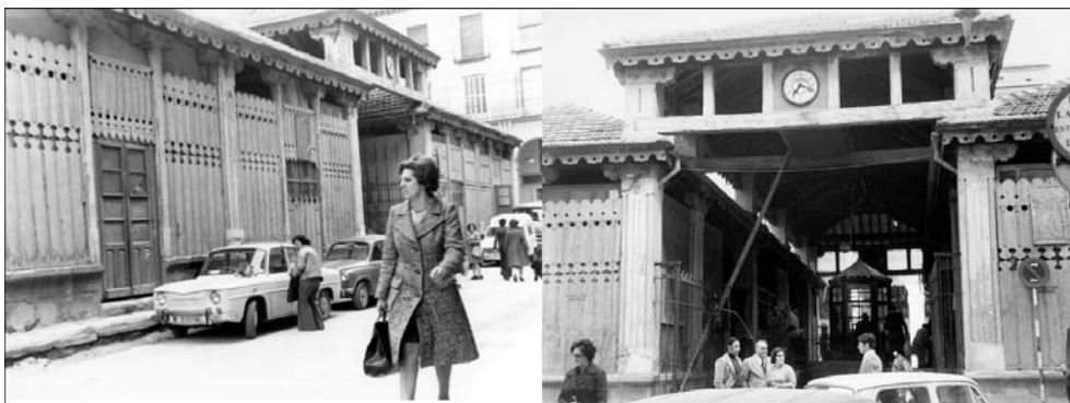
Imagen del antiguo mercado de madera de la Plaza López Allué de Huesca antes de su demolición.

señalar que la propuesta se hizo justo un año después de demolerse el famoso mercado levantado en madera que ocupaba este solar.