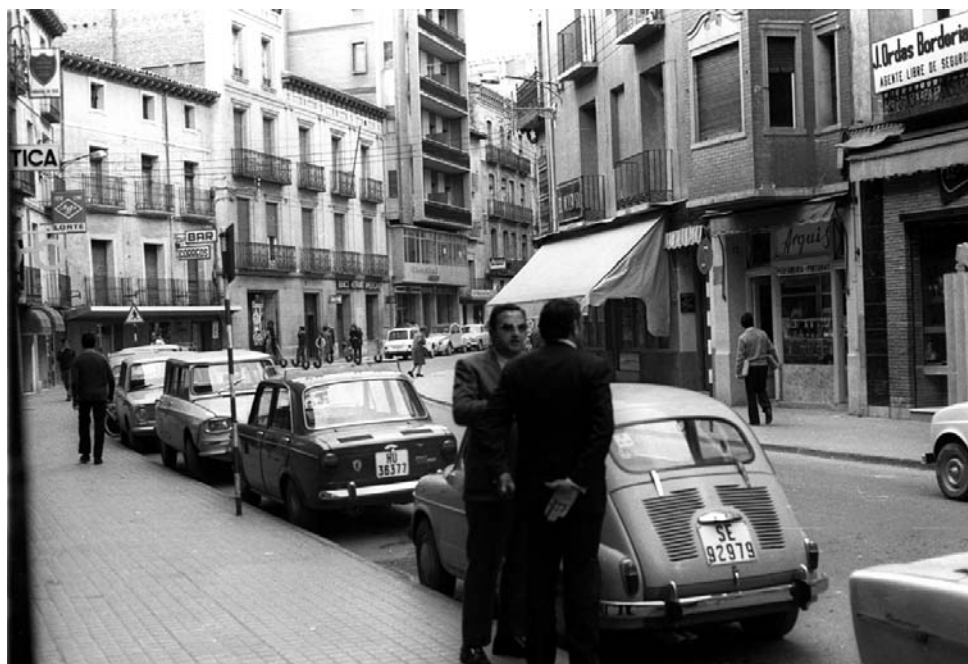
Imagen del Coso Alto de Huesca durante la Transición.