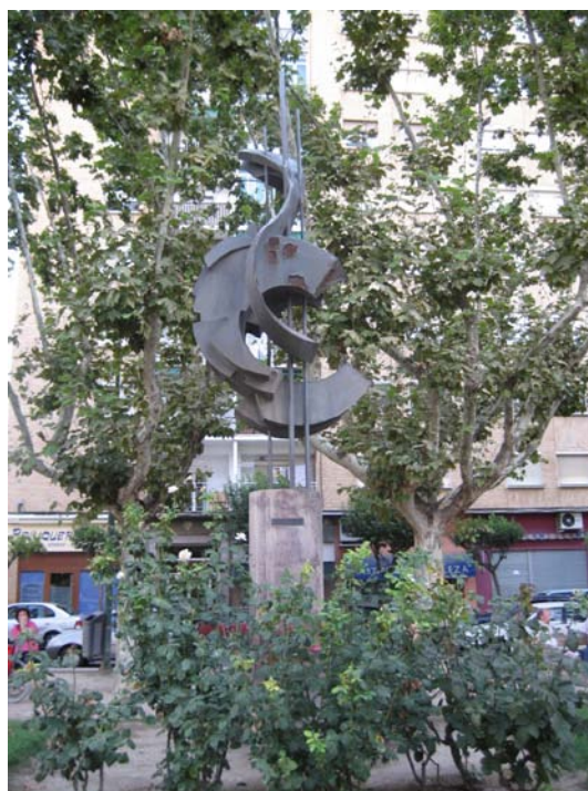
Monumento dedicado a la Agricultura y la Industria en Martínez de Velasco. El autor es Iñaki.

En 1981 17 , la documentación señala que la corporación municipal agradece al Banco de Huesca la donación de un monumento dedicado a la Agricultura y la Industria , instalado en Martínez de Velasco con motivo del centenario de la entidad. La documentación no menciona el escultor pero en el pie de la escultura se puede leer que el autor responde al nombre de Iñaki y como colaboradores a P. Prat y N. Floria.