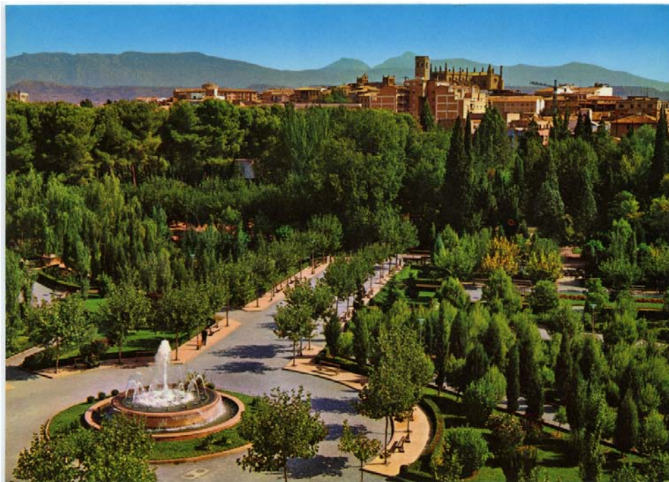
Imagen del Parque Miguel Servet de Huesca en torno a 1975. Fotografía de la Fototeca de la Diputación Provincial de Huesca, Colección Manuel Arribas, 00043.