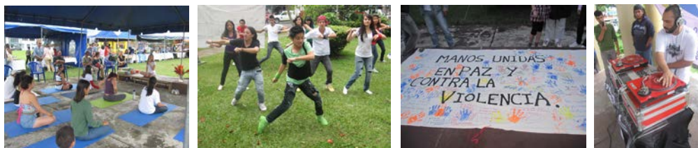
Fotografías 16, 17,18 y 19. Algunas actividades del Festival Montes de Oca Respira, 2010.

Como parte de estas alianzas en el año 2012 hubo un acercamiento con el colectivo Pausa Urbana, un grupo de multidisciplinario independiente que trabaja en la reactivación del espacio público, donde en conjunto con el TC-519 y la oficina de Desarrollo Social de la Municipalidad de Montes de Oca 7 , se creó el proyecto “Disfrutando la Amargura” 8 , como parte de un esfuerzo colectivo.