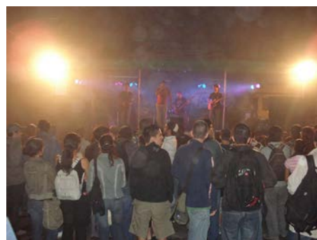
Fotografías 14 y 15. Algunas actividades del TC-519 en el 2007

En dicho proceso se celebraron actividades recreativas, deportivas, artísticas, capacitaciones, entre otras, en todos los distritos de Montes de Oca, se involucró a las asociaciones de desarrollo de las comunidades, escuelas y colegios públicos, colectivos de artistas e instituciones públicas, dentro de las cuales se pueden citar: Municipalidad de Montes de Oca, Universidad de Costa Rica, TCU Calle de la Amargura hacia una renovación física, recreativa y cultural, la fundación el Arte de vivir, Epicentro Urbano, Ministerio de Seguridad Pública, Ministerio de Salud, Viceministerio de Justicia y Paz, Comité de la persona joven, ONU-Hábitat, entre otros.