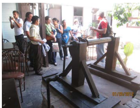
Fotografías 1 y 2. Patrimonio histórico arquitectónico en la Calle de la Amargura. La primera fotografía corresponde a la primera escuela de San Pedro, la segunda a un pozo de la estación ferroviaria. Taller del TC-519 sobre patrimonio tangible e intangible en la Calle de la Amargura.