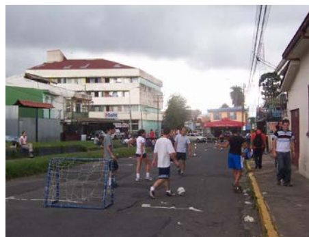
Fotografías 12 y 13. Primeras actividades del TC-519 (2005), pasacalles y campeonatos deportivos.