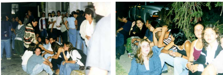
Fotografías 6 y 7. Jóvenes compartiendo en la Calle de la Amargura en 1997

c. Vinculación de actores sociales con el proyecto: En este eje de trabajo se busca la integración con otros actores destacados el proceso de transformación, este punto contiene un componente de investigación importante, además de la vinculación con otros grupos o individuos en el contexto de la Calle de la Amargura, se llevan a cabo encuestas de percepción de usuarios y usuarias, las cuales se realizan desde el año 2005 a la fecha (2013), además se efectúan sondeos sobre actividades específicas a la población beneficiaria. Como parte de este componente de trabajo el TC-519 ha sido parte de diferentes redes, dentro de las que se puede mencionar: Centros de Estudios Locales en epidemiología de drogas de Montes de Oca (CEL), parte del proyecto “Redes para la convivencia comunidades sin miedo” con el enlace de ONU-Hábitat, parte de las agendas de Espacio Público, Cultural y Niñez y adolescencia de Montes de Oca. Además de esta vinculación ha existido un estrecha relación con la oficina de Desarrollo Social de la Municipalidad de Montes de Oca, que ha servido de puente para llegar a diferentes grupos organizados de la comunidad.