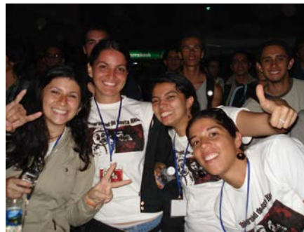
Fotografías 10 y 11. Equipo del TC-519 en diferentes momentos, 2007 y 2008 respectivamente