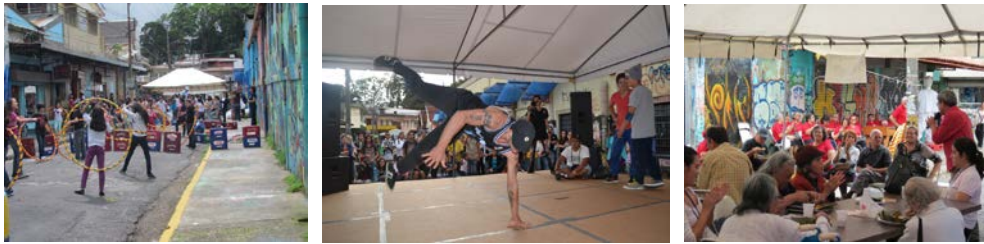
Fotografías 20, 21 y 22 . Algunas actividades Disfrutando la Amargura, dedicada a los niños en agosto 2013, en abril 2013 a expresiones urbanas y julio 2013 a los adultos mayores.