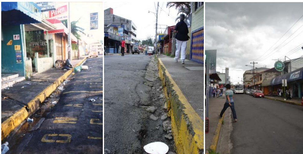
Fotografías 3, 4 y 5. Calle de la Amargura en 1997, 2007 y 2013, respectivamente