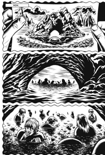
Figura 3 (font: Burns, 2005)

El forat negre no és només l'exoesquelet d'aquests textos, les entranyes del qual es tornarien visibles a estones —per representació gràfica o al·lusió verbal—, sinó la possibilitat última de la seva producció, del moviment del relat mateix: la plenitud i la producció a les que es referia Hawking poden ser aquí anàlogues a les d'una escriptura que es construeix a partir de les traces escàpoles del seu moviment 16 . És en aquest sentit que matisaria les consideracions d'Emma Jacobs a propòsit de la novel·la gràfica de Burns, segons la qual el forat negre seria l'expressió d'una buidor i una negativitat que Jacobs també detecta en els personatges (Jacobs, 2014: 57), i les d'Andrea Kottow, a propòsit de l'obra de Meruane, qui considera que el forat negre hauria succionat tota l'energia d'Ella (Kottow, 2019: 17). Suggestiria que més que relacionar-se amb la buidor o la falta, en ambdós casos aquest forat es relaciona amb una plenitud ben productiva, per bé que els personatges semblen participar d'aquesta inconscientment.