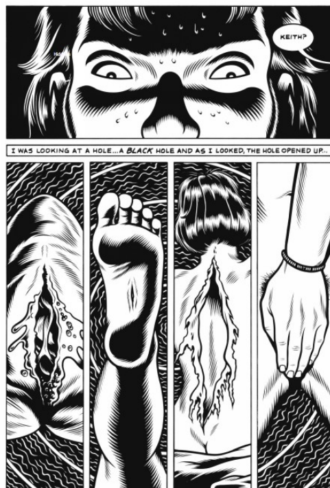
Figura 1 (font: Burns, 2005)

Assumint totes aquestes ressonàncies, la pregunta de la que es parteix és força més específica: a què respon l'ús de la imatge del forat negre en aquestes obres? Ambdós autors col·loquen aquesta a l'inici mateix dels seus textos, i en el cas de Burns, també intitula l'obra. Aquí el forat negre apareix com una visió derivada del desmai que sofreix un dels personatges protagonistes, Keith, qui s'ha vist profundament afectat per la contemplació de les entranyes d'una granota que està disseccionant a la classe de Biologia de l'institut. Tal forat negre es representa a partir de diferents traus, ferides i cavitats de cossos humans i animals, anàlegs a l'objecte còsmic per l'ús d'una paleta de colors que es redueix al contrast pur de blanc i negre ( figura 1 ) 2 .