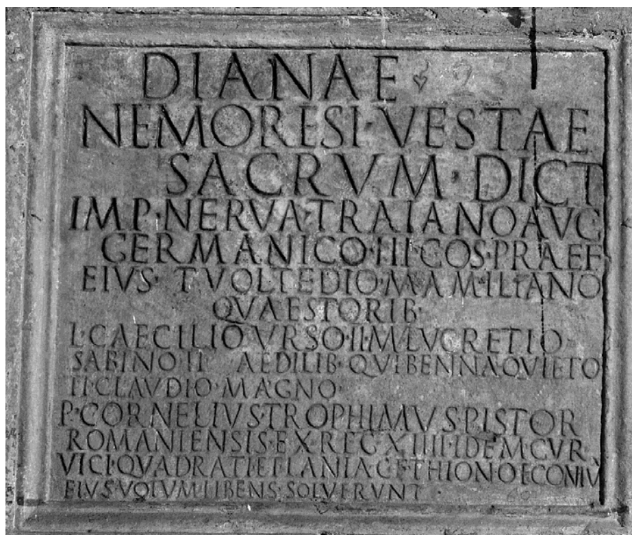
Fig.1 – CIL XIV 2213

DIANAE NEMORESI VESTAE SACRVM DICT IMP NERVA TRAIANO AVG GERMANICO III COS PRAEF EIVS T VOLTEDIO MAMILIANO QVAESTORIB L CAECILIO VRSO II M LVCRETIO SABINO II AEDILIB Q VIBENNA QVIETO TI CLAVDIO MAGNO (uacat) P CORNELIVS TROPHIMVS PISTOR ROMANIENSIS EX REG XIII IDEM CVR VICI QVADRATI ET LANIA C F THIONOE CONIV(x) EIVS VOTVM LIBENS SOLVERVNT