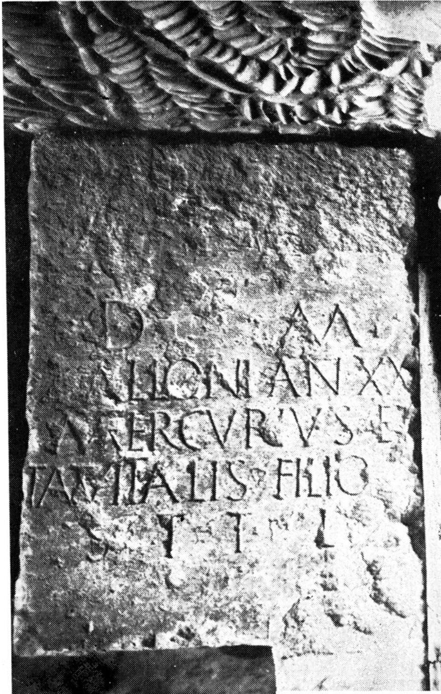
Fig. 1. Ara de Allo y de Tautia Vitalis