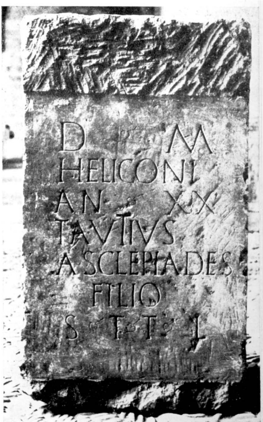
Fig. 2. Ara de Hygina