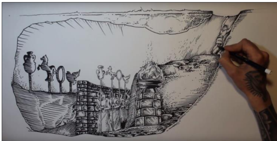
Fig. 3. Fotograma del vídeo El mite de la caverna (maig 2017).

Encara que la xarxa ja disposi d'audiovisuals susceptibles de ser treballats en tots aquests sentits, a Cinestèsia ens dediquem a crear-ne de nous i pensats específicament per a l'aprenentatge del grec. Fins ara hem creat i experimentat amb diferents tipologies de vídeos per tal d'explorar les seves possibilitats didàctiques.