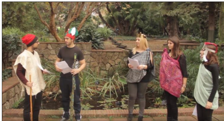
Fig. 1. Fotografia del grecmetratge El judici de Paris amb proemi d'orenetes (desembre 2016).

La primera prova que vam fer en aquest sentit va ser una adaptació teatral del Judici de les Deesses de Llucià de Samòsata al Màster de Formació del Professorat de Secundària Obligatòria i Batxillerat, Formació Professional i Ensenyament d'Idiomes de la Universitat de Barcelona (fig. 1). 2