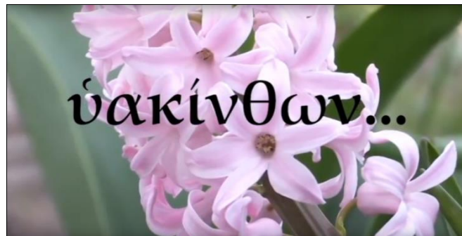
Fig. 4. Fotograma del vídeo Arribada a l'Illa dels Benaurats (juliol 2017).

El segon audiovisual 6 consisteix en una seqüència d'imatges amb una lectura oral d'un passatge dels Relats verídics de Llucià (Luc. VH 2.5), 7 acompanyada de subtítols per facilitar-ne la comprensió auditiva. El principal contingut didàctic del vídeo és la sonoritat del grec i la seva representació alfabètica. Està pensat per a un alumnat principiant per tal que pugui practicar i retenir les grafies gregues i la seva pronunciació. Aquesta associació entre els fonemes i les grafies està complementada, a més, amb una associació de termes lèxics: significat-significant. Algunes de les flors que hi apareixen són, al seu torn, fonèticament similars a les del català o castellà, com, per exemple, ῥόδων, βαρκίσσων o ὑακίνθων (fig. 4).