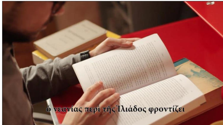
Fig. 5. Fotograma del vídeo ΚΑΘ'ΗΜΕΡΑΝ (març 2018).

preposicionals que es poden identificar tant visualment, a través de les imatges i dels subtítols, com auditivament, amb una veu en off que llegeix el text escrit (fig. 5). El vídeo i la unitat didàctica adjunta 9 estan destinats, en principi, a alumnes de primer curs de grec. 10