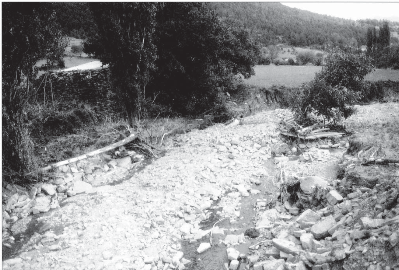
Foto 6.- Erosió lateral en el canal de Betés