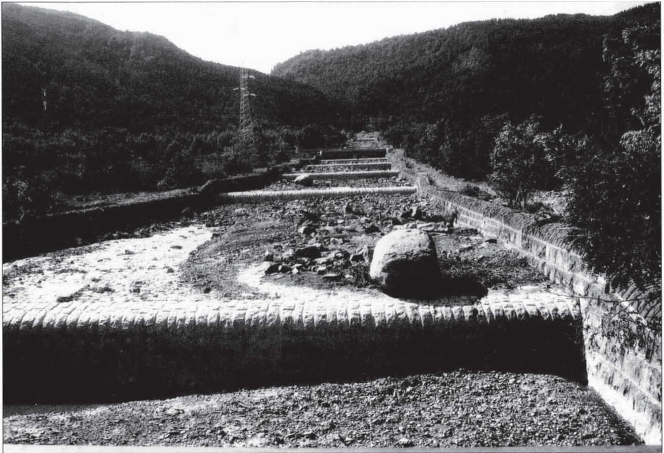
Foto 1.- Canal de drenatge construït en el tram final del Barranco de Arás i blocs transportats per la riuada del 7 d'Agost de 1996 (Punt c en la figura 1)

amb una secció d'entrada de 30 m 2 i una capacitat de drenatge estimada de 150 m 3 s -1 , cabal que correspon a un període de retorn de 100 anys.