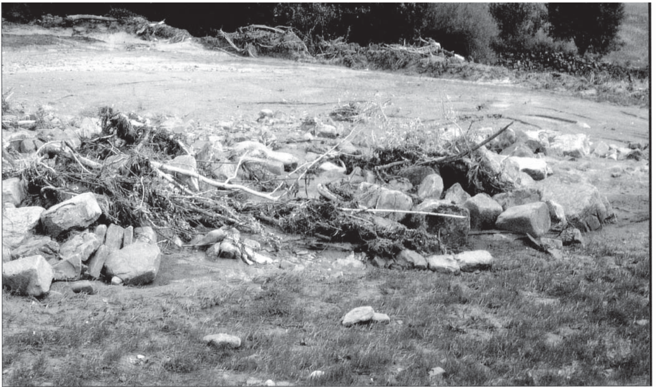
Foto 3.- Còdols arrossegats per la riuada sobre camps de conreu en terrasses en la conca de Betés, aigües avall del poble de Betés