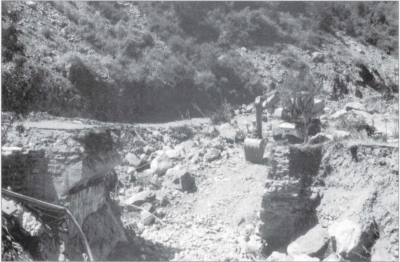
Foto 5.- Pont destruït en la confluència del Barranco de Aso i la carretera a Yosa de Sobremonte (Punt a en la figura 1)