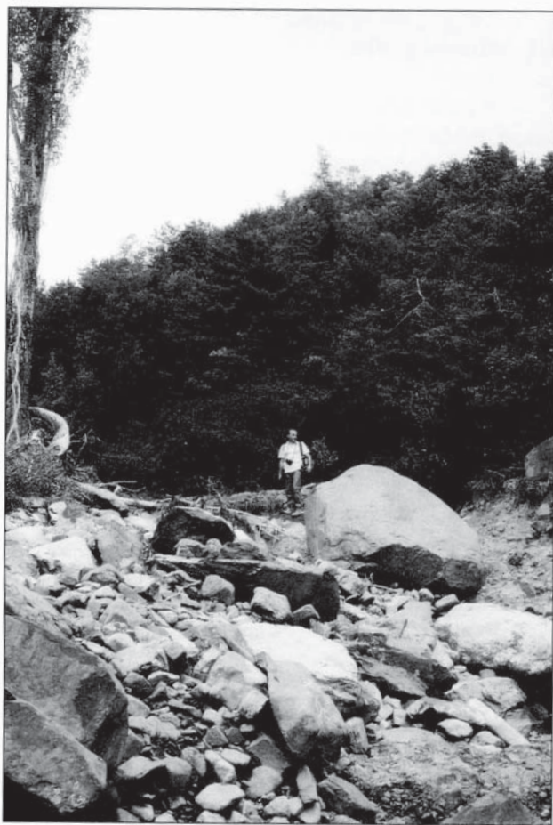
Foto 2.- Mobilització de material al Barranco de Betés en el pont de la carretera a Aso de Sobremonte (Punt b en la figura 1)

A més a més el desbordament del torrent va destruir els murs de contenció de les terrasses de diferents camps de conreu. El flux d'aigua que va circular per sobre de les terrasses va arrossegar còdols del d'un metre de calibre i 500