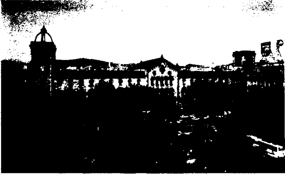
Edificio de la Universidad de Barcelona. Plaza de la Universidad.

des de aulas. Pero además psicología reclamaba algo más, despachos, laboratorios, biblioteca... Una circunstancia afortunada permitió un primer respiro: la Facultad de Ciencias dejó libre en el Patio de Ciencias unos espacios que desde los comienzos de siglo ocupaba la cátedra de química, concretamente un despacho y dos laboratorios, y nuestra Facultad nos los atribuyó. Yo ocupé el despacho, uno de los laboratorios lo transformamos en laboratorio de psicofisiología y el otro en sala de prácticas de estadística.