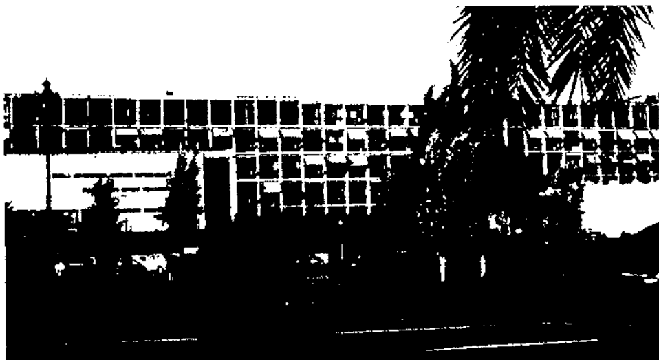
Edificio de la Escuela Universitaria de Estudios Empresariales. Pedralbes.