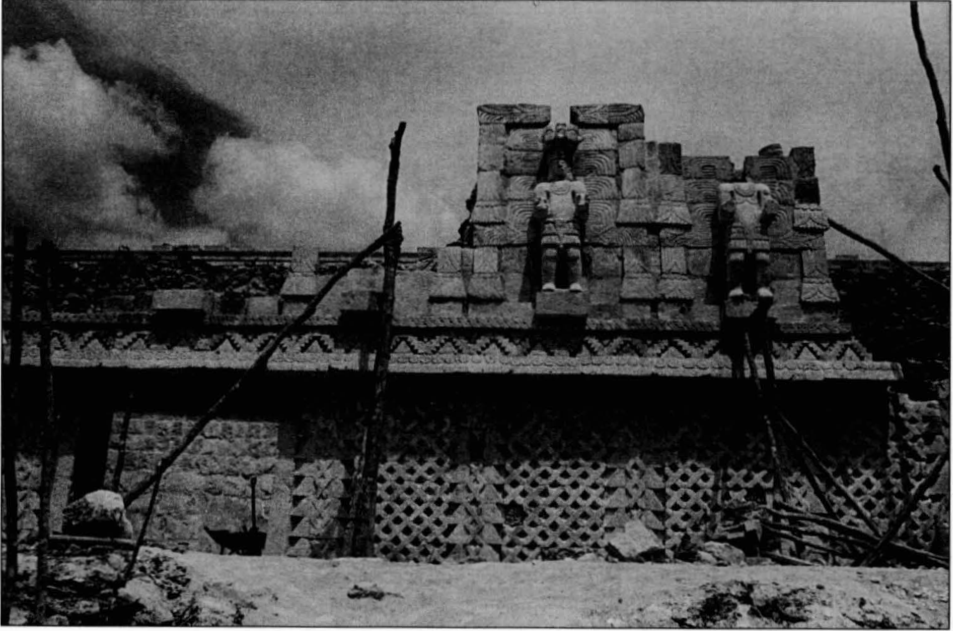
Fachada Este del Codz Pop