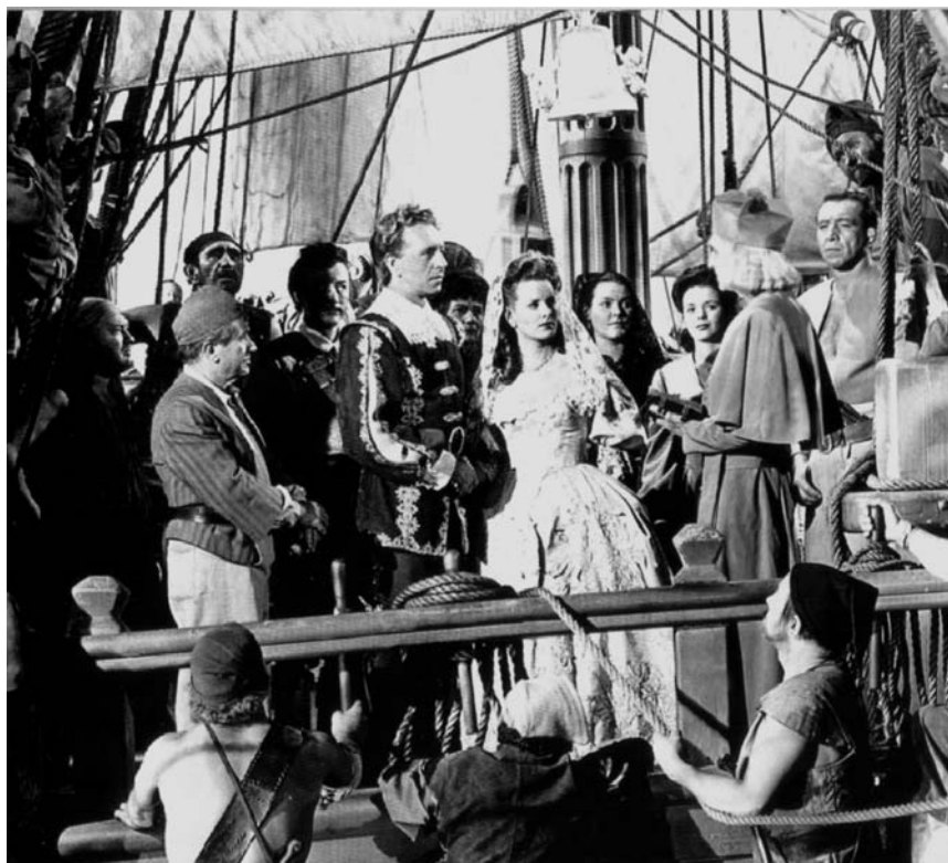
Figura 1. Fotograma de la película Caribe

siglo XVIII, el filme narra la historia de Laurent Van Horn, patrón de un barco holandés que embarranca en las costas de Cartagena, cuyo virrey es Juan Alvarado de Soto. Este hace prisionera a la tripulación holandesa, que sin embargo logra huir y adueñarse de un barco. Van Horn se convierte entonces en el famoso pirata Barrancuda, deseoso de vengarse del imperio español. Su plan será raptar a la prometida del virrey, Francisca de Guzmán y Argandora, quien terminará por enamorarse del capitán holandés. Se trata de una película de batallas navales, duelos de espadas y amor romántico, donde los españoles aparecen como aristócratas holgazanes y conservadores en contraposición al carácter moderno, práctico y civilizado de los holandeses. El Caribe es de nuevo representado como un lugar abandonado a su suerte, como un territorio gobernado por las pasiones e impulsos de un conjunto de individuos de turbio pasado que han terminado por recalar en las aguas tropicales. Aquí no hay la más mínima referencia al contexto cultural o demográfico del archipiélago, si bien se utiliza de nuevo el recurso a una naturaleza salvaje y desmesurada como símbolo de la psicología interior de los personajes que en ella habitan. Estas son unas ca-