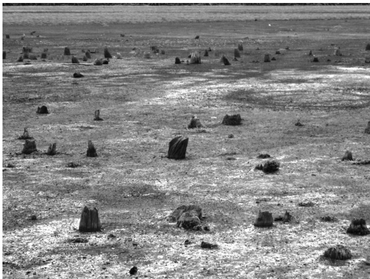
Imagen 1. Estearia del Coqueiro, Olinda Nova do Maranhão. Época de la sequía. Fotografía de Alexandre Guida Navarro, 2013.

El área donde se encuentran los palafitos se denomina la Baixada Maranhense, y se sitúa en la Amazonía oriental, aproximadamente a 200 km al suroeste de la capital del estado de Maranhão, Brasil. Comprende una región de 20 km 2 , donde viven alrededor de 500.000 personas, y se caracteriza por una gran pobreza y con bajos niveles de desarrollo humano, de acuerdo con el censo del IBGE correspondiente al año 2006. La población vive de la horticultura tradicional, la pesca, la crianza de animales y la explotación de recursos vegetales como el coco de «babaçu». Las principales ciudades de este territorio son Pinheiro, Viana, Penalva y Santa Helena (Navarro, 2013).