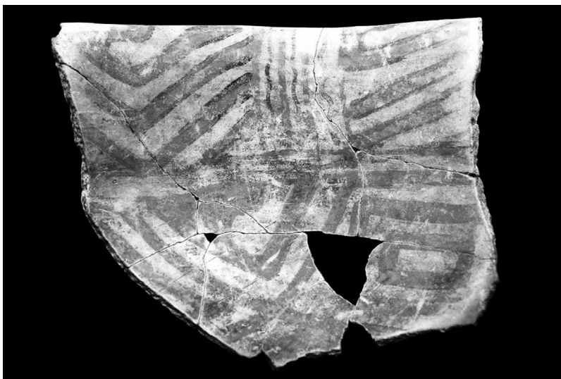
Imagen 4. Fragmento de cerámica de color negro y rojo sobre fondo crema.

Otras vasijas que aparecen en menor proporción son las que disponen de asa y cuello de botella. En la iconografía destacan los rasgos geométricos que delimitan patrones de composición estilística de la vasija: grecas o líneas en espiral que van circundando el interior de la pieza. Los colores predominantes son el rojo y el negro pintados sobre un engobe blanco, que en el contexto de la cerámica es una suspensión de materiales plásticos y no plásticos más agua. Es muy probable que los dibujos de estos artefactos sean representaciones del caparazón de tortugas o de la piel de serpientes de la región, como la surucucú o Lachesis muta , comunes en el área geográfica de la Baixada Maranhense (imagen 4).