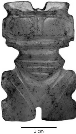
Imagen 2. Muiraquitã sacado de la estearia de la Boca del Rio.

tes categorías: forma rasa, platos y asadores, vasijas del tipo de media esfera, media «calota», esférica, estatuillas y torteras. La principal característica de la colección es la presencia de pequeñas vasijas cerámicas que probablemente servían para almacenar líquidos o semillas para el plantío (Burke, Ericson y Read, 1972). Algunas tienen incisiones en el borde de la cerámica, otras están pintadas de negro y rojo sobre engobe blanco. Los platos son utensilios planos y tienen marcas de cestas, siendo el más común el trenzado. Las estatuillas de cerámica indican la presencia de rituales y están caracterizadas por la representación de animales, sobre todo el búho, el mono, la tortuga y la rana. Algunas de ellas son antropozoomorfas, aunque la zoomorfa es la más común, y la mayoría tiene un patrón escultórico: las piernas están abiertas formando una media luna y muestran el órgano genital (imagen 3).