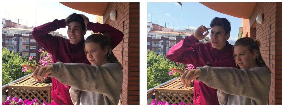
FIGURA 1. Imatges que mostren el gest d'assenyalar i l'expressió facial de sorpresa de l'interlocutor (esquerra), així com el mateix gest d'assenyalar i l'expressió facial d'incredulitat de l'interlocutor (dreta).

El contingut comunicatiu del discurs és, doncs, una combinació del que expressem i comprenem a través de la modalitat oral (la parla) i de la modalitat visual (els gestos i les expressions facials). No es pot entendre l'una sense l'altra i per això és necessari adoptar una visió multimodal del llenguatge que analitzi de manera integrada les dues modalitats i entengui que els gestos actuen com a elements lingüístics i comunicatius amb un valor comparable al de les paraules.