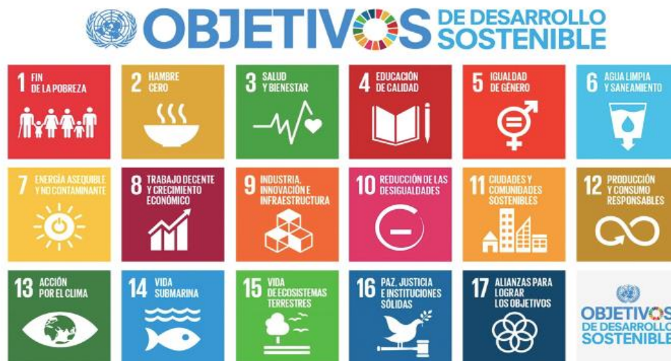
Ilustración 1: Objetivos de Desarrollo Sostenible con los iconos y logos oficiales de las Naciones Unidas