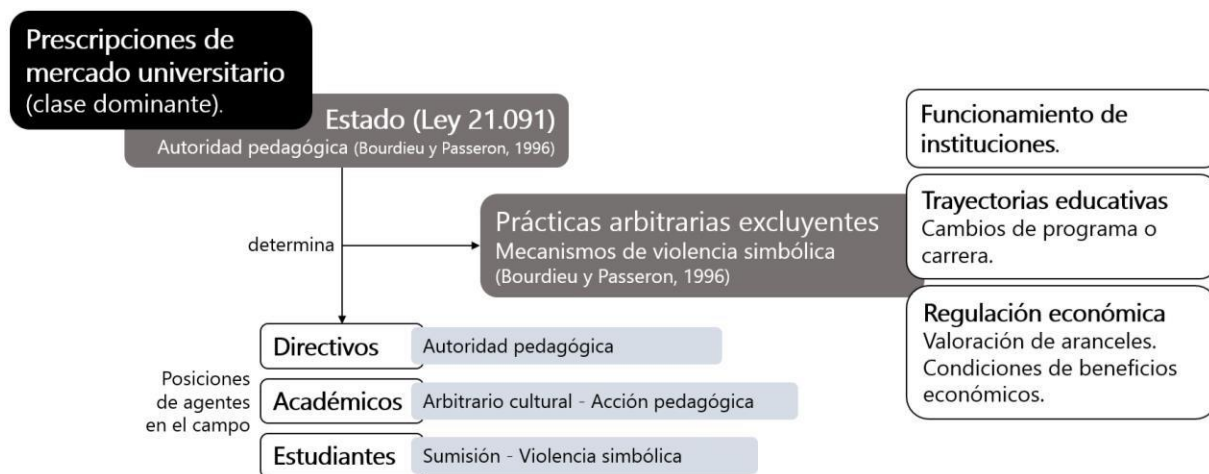
Figura 3. Lo Invisibilizado: Prácticas arbitrarias excluyentes

De manera consistente la Subsecretaría de educación superior se instituye como autoridad, ya que se reconoce a sí misma por encima de otros agentes, siendo en juicio y razón parte de una dominación jurídica (Bourdieu, 2001), es decir se transforma en un instrumento de reproducción social (Bourdieu, 2013), y también reconoce que otros agentes están bajo disposición de su soberanía que tiene primacía de dominación en el campo universitario (Bourdieu, 2013). Esta posición en el campo requiere de un modelo basado en la imposición jerárquica y autoritaria, reproduciendo prescripciones de funcionamiento propias del mercado universitario.