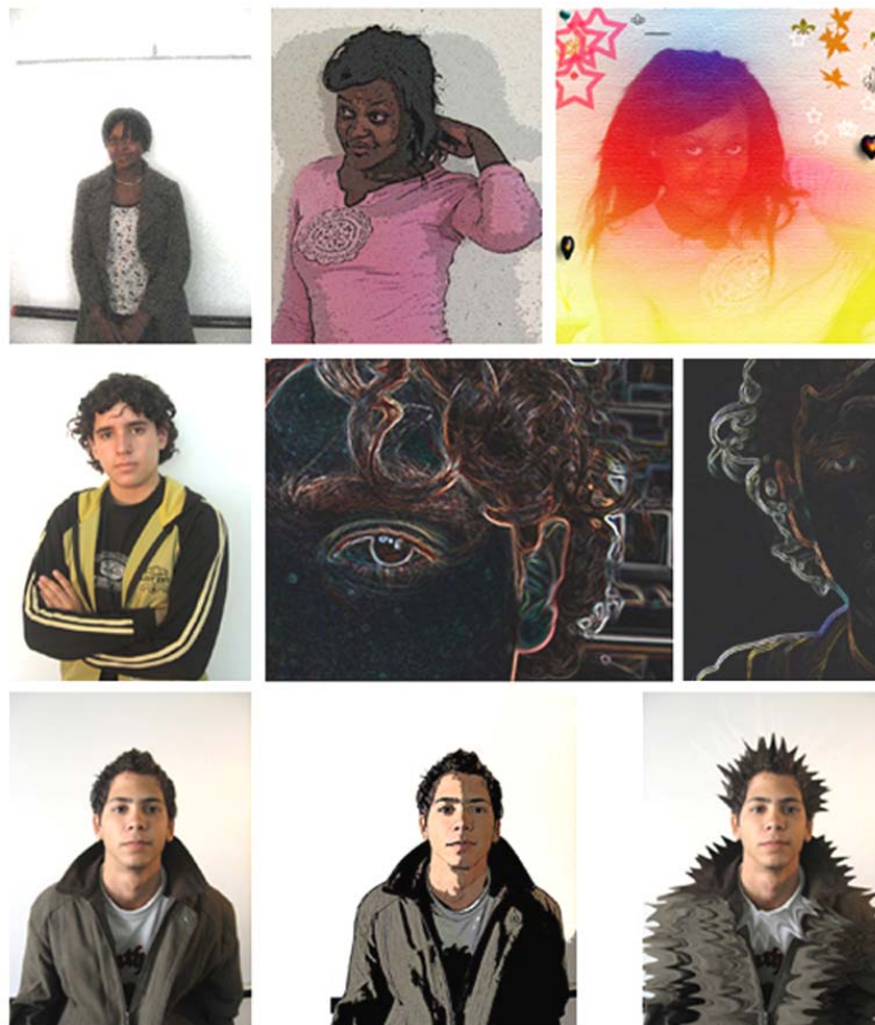
El retrat com a mitjà d'autoconeixement. L'autoretrat, filtres com a mitjà d'expressió dels sentiments.