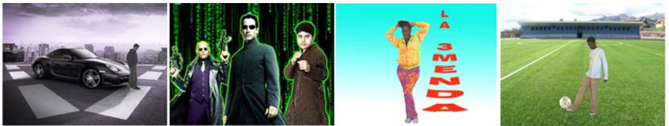
El simulacre com anhel

Les consignes de treball són: jo mateix, el model. Transformació de la identitat, transformar-se en un integrant d'un grup social concret. S'ha de posar per a la foto, actuar i disfressar-se si cal. S'ha de muntar un cartell o inventar-se un reportatge sobre el personatge creat.