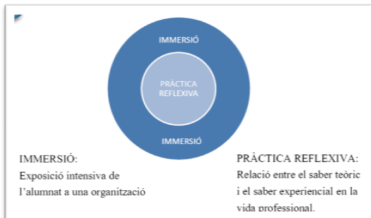
Fig. 3. Metodologia de les pràctiques externes (Aneas et al., 2012)