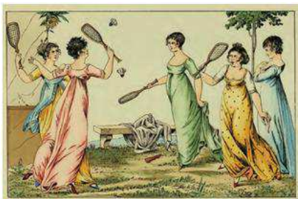
Figura 2. Joc del volant, practicat per dones.

Unes pràctiques també de diades festives, però també molt en voga en el dia a dia, són els jocs de xarranca i les seves nombroses variants, com el marro i el titllo (Amades, 1947), anomenats amb altres noms en castellà com «tánganas, tejos o chitas» (Santos, 1876). Són en general d'ambdós sexes i practicables pels carrers en qualsevol moment, tal com es comprova en diversos gravats, com el de l'obra Juegos de la Infancia (vegeu la figura 3). A més, no impliquen una gran despesa física ni tampoc un contacte entre companys, característiques òptimes perquè el joc el duguin a terme les noies.