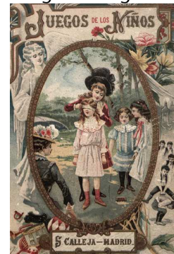
Figura 5. Noies a punt de jugar al puput o gallina ciega.