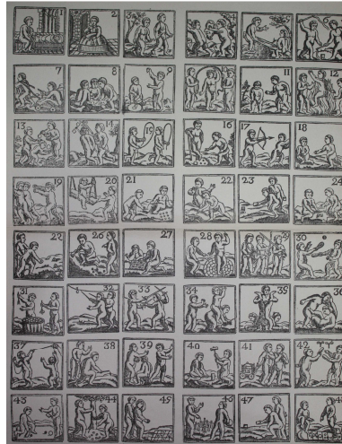
Figura 1. Facsimil de l'auca de 1674, Jochs d'Infanteça.