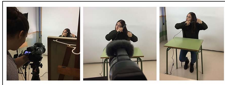
Figura 1. "Irene pentinar-se". Fotoensayo compuesto por tres fotografías de la autora

M. D. Arcoba-Alpuente. El videoensayo como recurso pedagógico en la búsqueda y construcción de identidades en enseñanza secundaria desde la educación artística