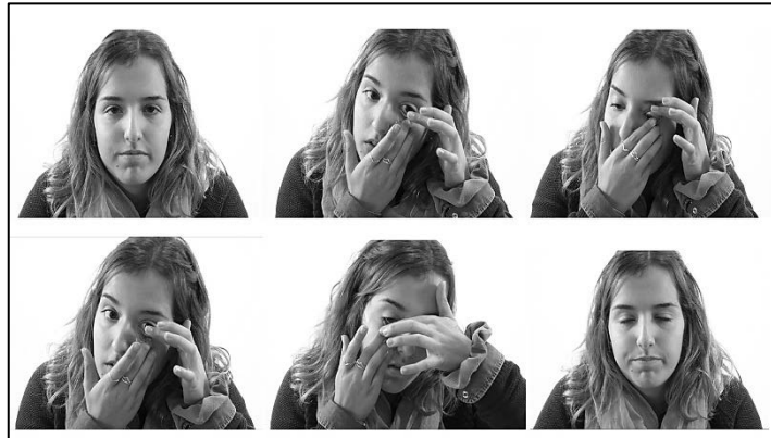
Figura 6. “Lentillas de Escoví”. Serie secuencia compuesta por seis fotogramas del videoensayo realizado por Mireia Escoví alumna del I.E.S. Clot del Moro de Sagunto