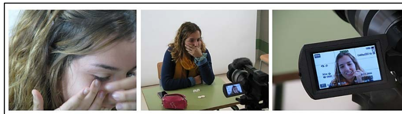
Figura 3. "Lentillas de Mireia". Fotoensayo compuesto por tres fotografías de la autora