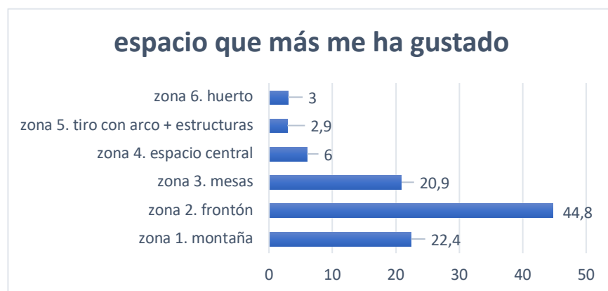
Gráfico 4: Qué espacio me ha gustado más

Según el alumnado, la zona más utilizada ha sido el frontón y el espacio central, lo que coincide con la observación de la alumna universitaria. El frontón ha sido la zona que más les ha gustado (44,8%), y la que más tiempo han ocupado según su percepción (50,7%). Sin embargo, consideran que han pasado menos tiempo en la montaña (7,5%) que el observado por la estudiante universitaria y ello puede ser debido a que ha sido un espacio que les ha gustado (22,4%) y que se les ha hecho corto el tiempo empleado.