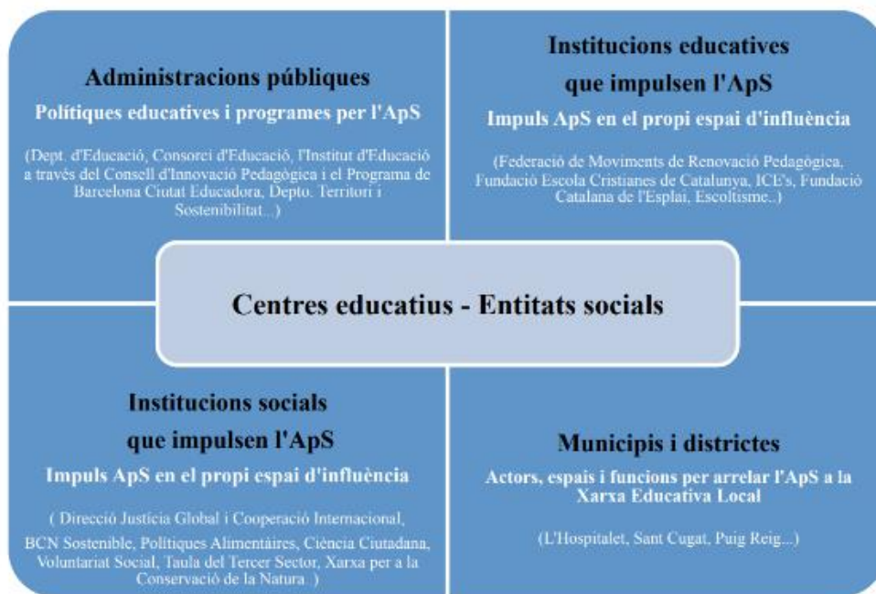
Figura 1. Actors implicats en l'impuls de l'aprenentatge servei.

2020). La principal aportació d'aquest document és fer una aproximació als actors que és necessari moure i les accions necessàries per fer-ho, de manera que es diversifiquen i multipliquen les experiències per conformar un veritable territori educador ric. Per fer-ho s'identifiquen les diferents administracions, institucions educatives i socials de segon ordre, així com l'administració municipal i els actors locals que podrien jugar rols clau i es defineixen possibles funcions principals a assumir.