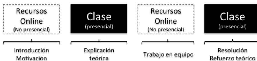
Figura 1: Metodología docente empleada

mejor tanto las causas y consecuencias, como las políticas económicas a emplear. Con esta motivación, se diseñó una clase práctica que combina algunos de los elementos que hemos señalado en el apartado anterior: (a) el trabajo en equipo; (b) el empleo de recursos bibliográficos y online; (c) la interacción entre docente y alumno; y (d) el estudio autónomo. La práctica se realiza en dos sesiones de 1 hora y 30 minutos cada una, además del trabajo que los estudiantes deben realizar fuera del aula, de forma no presencial. Para ello, se evalúan las principales crisis financieras en la historia de España entre 1850 y 2014, ¿cómo afrontamos este reto? La Figura 1 ilustra la metodología docente empleada.