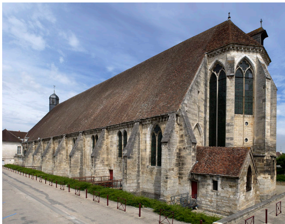
Fig.1. Tonnerre: Hôtel-Dieu, chœur et façade sud.

— 1991. Voluntate Dei leprosus. Les lépreux entre conversion et exclusion dans les sermons ad status aux XIIe et XIIIe siècles , Spoleto: Centro Italiano di Studi sull'Alto Medioevo