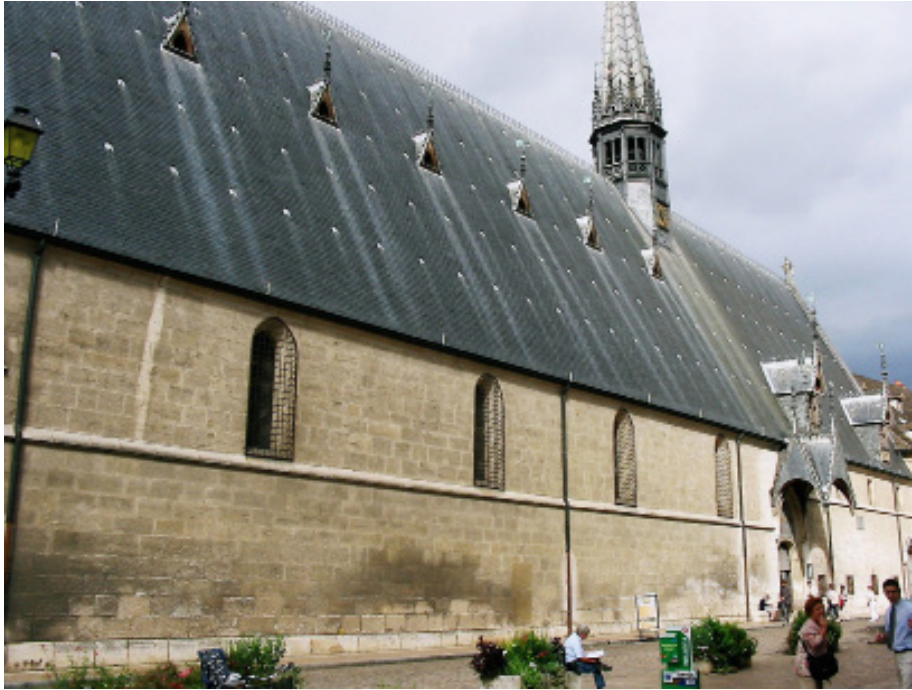
Fig.8. Beaune: Hôtel-Dieu, façade principale