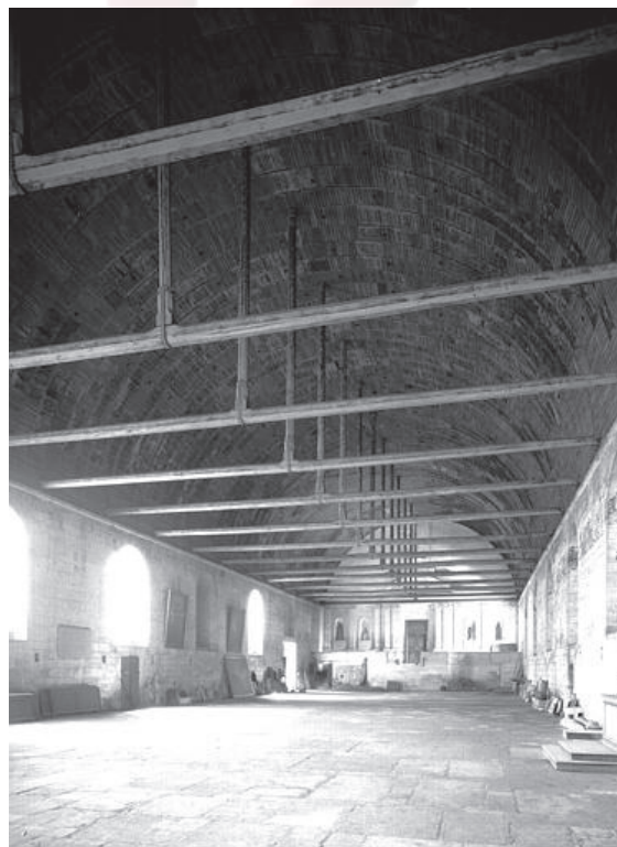
Fig.5. Tonnerre: Hôtel-Dieu, salle des malades vers l’ouest.