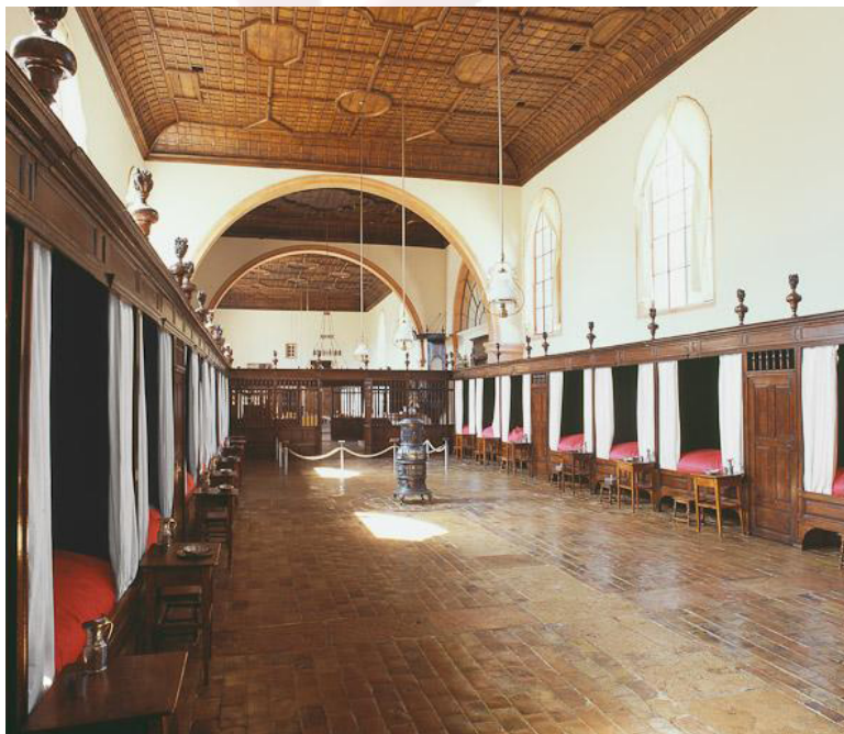
Fig.9. Tournus: Hôpital, salle des femmes