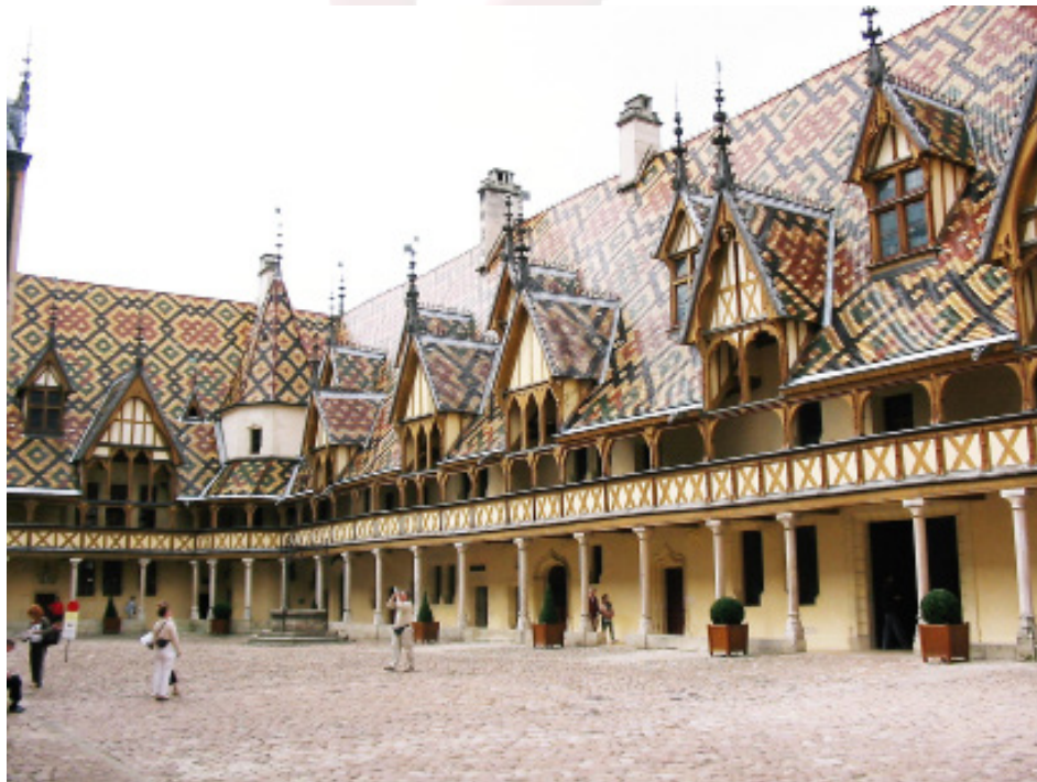
Fig.7. Beaune: Hôtel-Dieu, vue générale de la cour