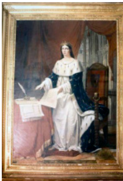
Fig.3. Jean-Joseph Ansiaux: “Portrait de Marguerite de Bourgogne”; 1825, peinture à l’huile sur toile. Tonnerre: Musée Hospitalier.