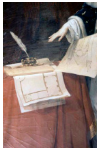
Fig.4. Jean-Joseph Ansiaux: “Portrait de Marguerite de Bourgogne”, détail; 1825, peinture à l’huile sur toile. Tonnerre: Musée Hospitalier (© Ministère de la Culture - base Mémoire).