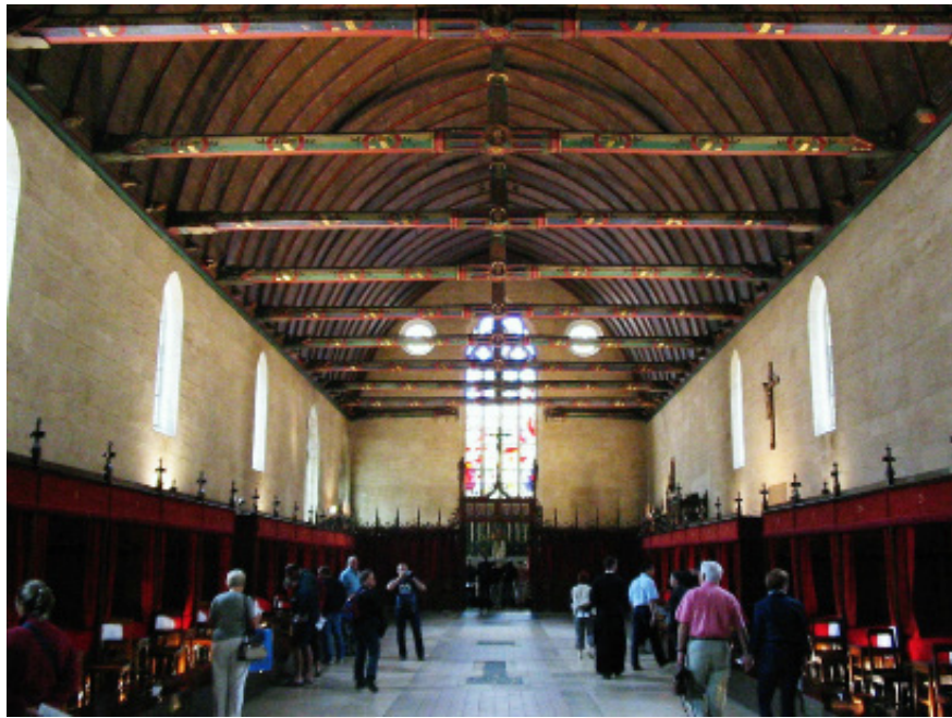
Fig.6. Beaune: Hôtel-Dieu, vue générale de la salle des malades