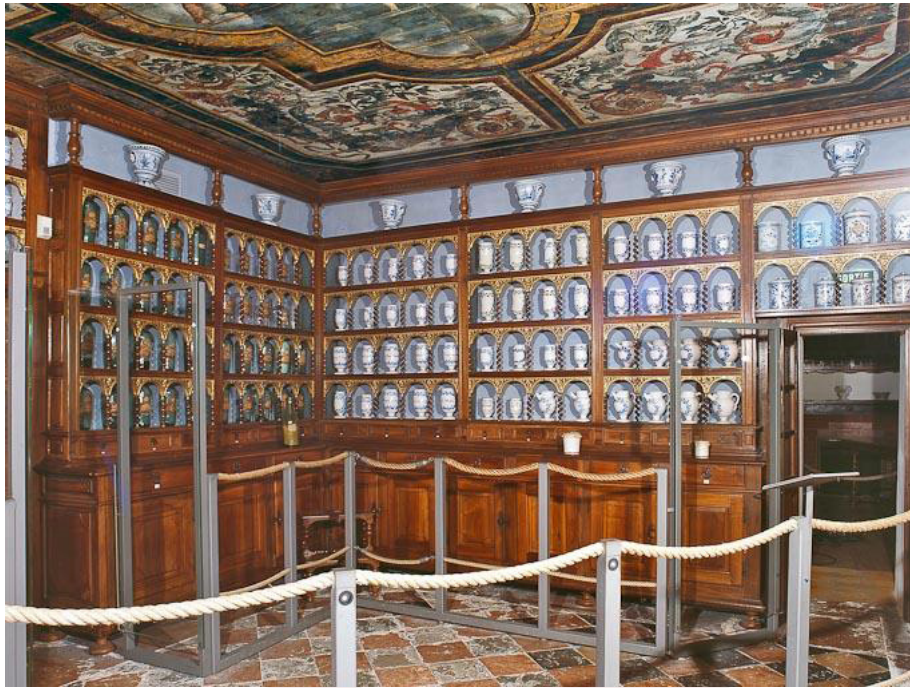
Fig.10. Tournus: Hôpital, apothicairerie, c. 1685