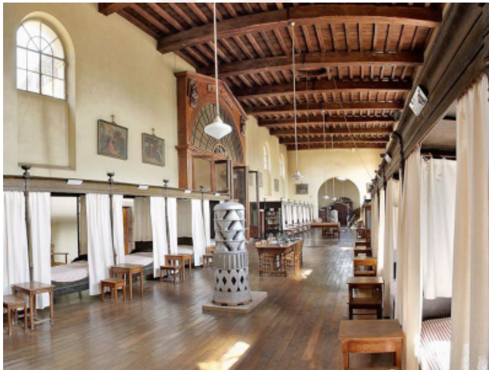
Fig.13. Louhans: Hôtel-Dieu, salle des hommes, dernier quart XVIIe s.-premier quart XVIIIe s.