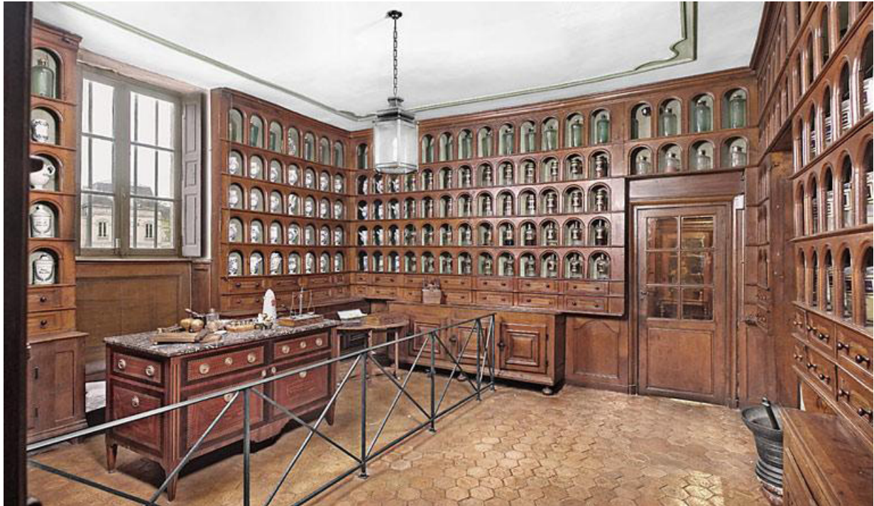
Fig.12. Louhans: Hôtel-Dieu, apothicairerie, dernier quart XVIIe s.-premier quart XVIIIe s.