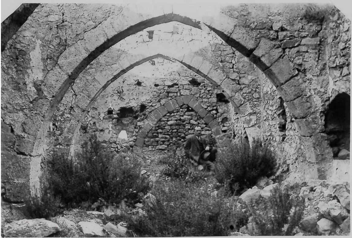
Fig. 7 Fotografia de l'interior de la mesquita-església presa el 1919.