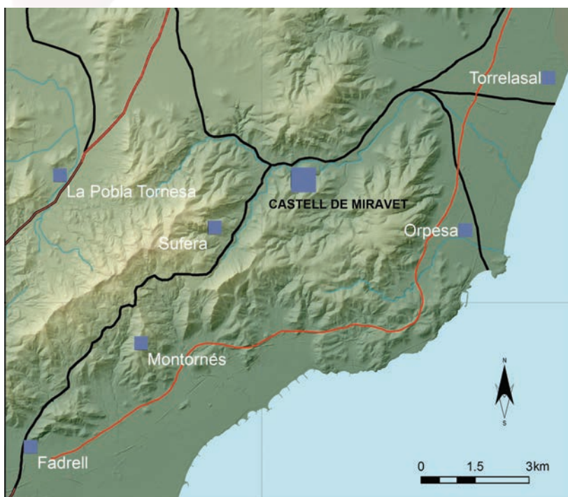
Fig. 2 Localització dels principals llocs arqueològics descrits a l'article.