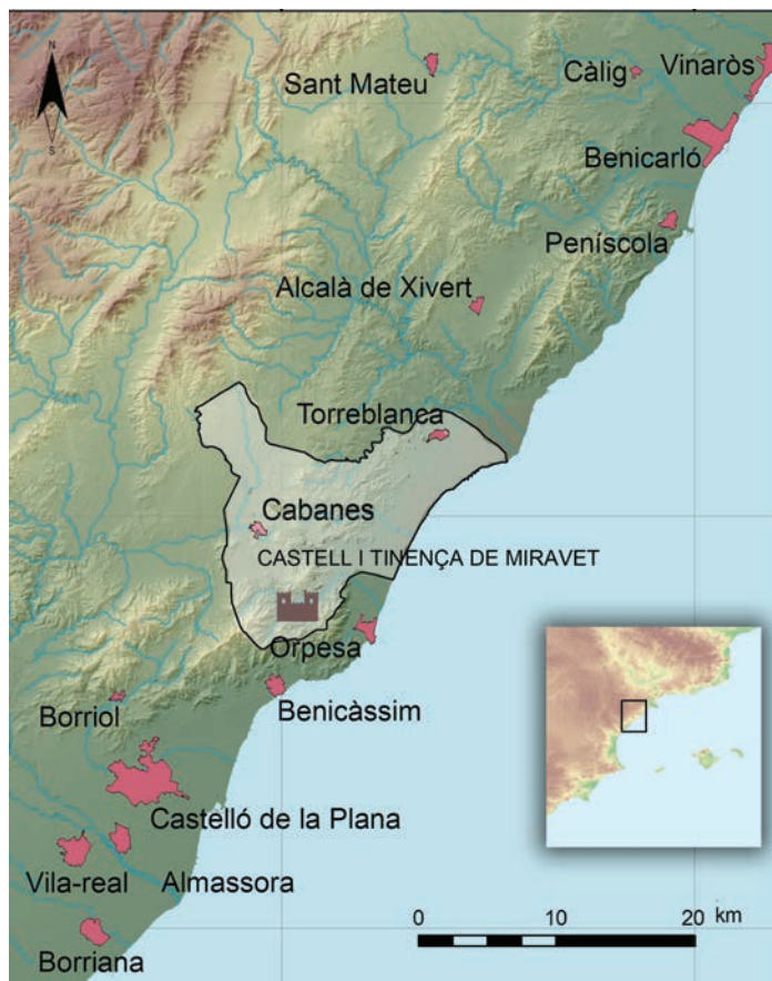
Fig. 1 Mapa de situació amb indicació dels municipis actuals.