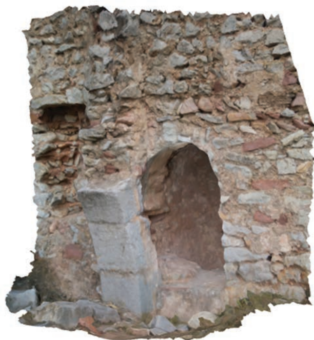
Fig. 6 Fotogrametria del mihṛāb i arrancament d'un dels arcs.