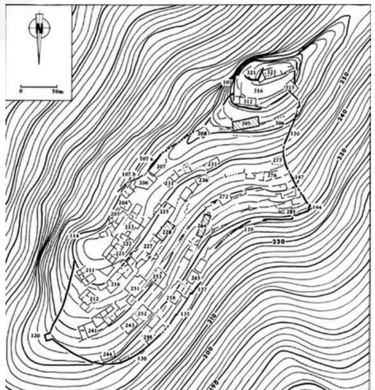
Fig. 4 Croquis de distribució de Miravet. Planimetria d'A. Bazzana.