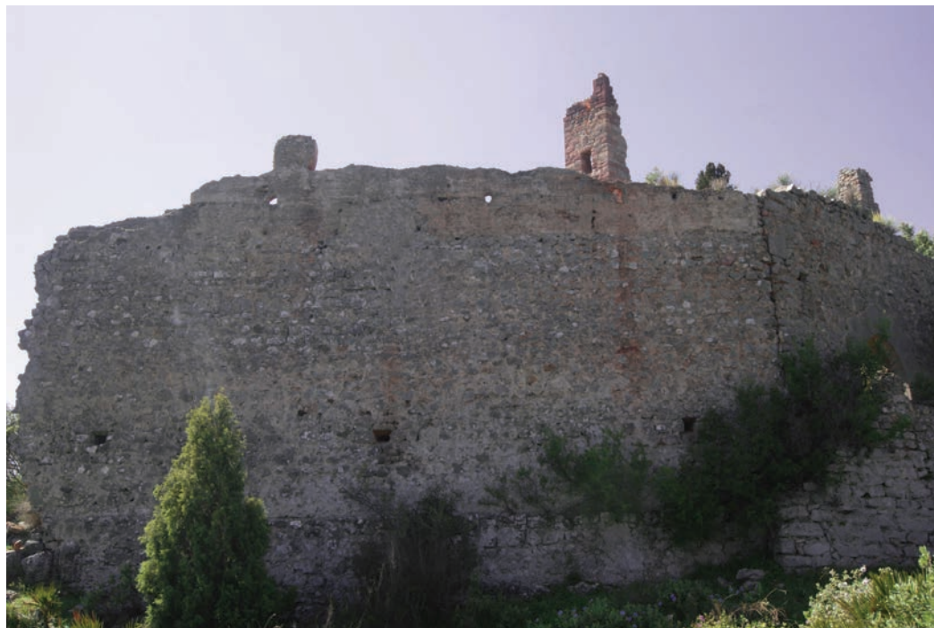
Fig. 5 Detall de les diferents tècniques constructives da la muralla del recinte superior.