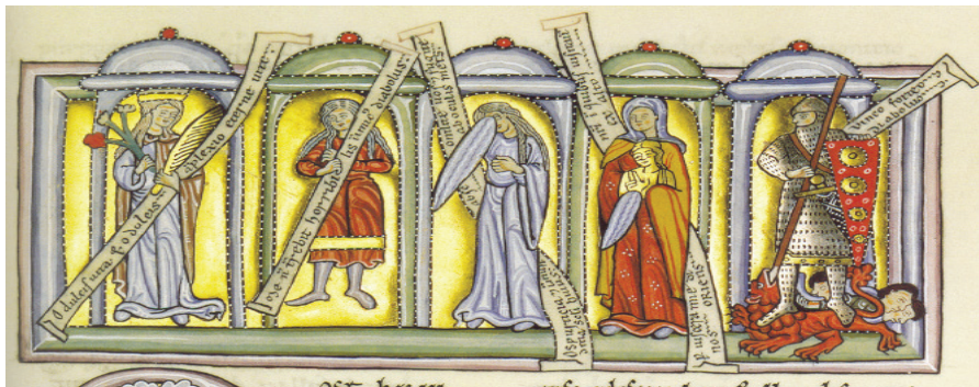
Fig. 2 La “Torre del Decret” (“ Turm des Ratschlusses ”). Miniatura del facsímil del Còdex Rupertsberg del Scivias en què hi apareixen les Virtuts següents (començant per l’esquerra): Amor caelestis , Disciplina , Verecundia , Misericordia i Victoria .

En aquest punt, abans de prosseguir en aquesta conjectura, convindria fer un breu excurs per indicar que, a banda de l’ Ordo , les Virtuts apareixen mencionades amb tota mena de detall en una altra obra hildegardiana, concretament en dos passatges del Scivias (III, 3 l. 160-593 i III, 8, l. 930-1245 ed. FÜHRKÖTTER 1978), escrits en prosa. En aquests dos fragments, en els quals Hildegarda comenta els atributs espirituals i físics de cadascuna de les Virtuts, hi ha un fet que ha passat desapercbut als estudiosos: les Virtuts del Scivias apareixen en el mateix ordre gairebé que el que trobem a l’ Ordo Virtutum , ara bé, mentre que en l’ Ordo les trobem totes seguides, una darrera l’altra, al Scivias apareixen separades en dos grups. Al quadre següent es poden observar, de manera més esquemàtica, l’ordre d’aparició de les Virtuts, tal i com els trobem a l’ Ordo i al Scivias (per a més detalls, veg. VERNET, E. i M. en premsa 2017: 43):