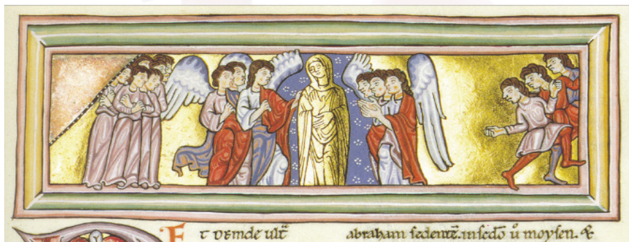
Fig. 4 Imatge central de la Scientia Dei . Còdex Scivias de Rupertsberg. Facsimil.

Una altra peculiaritat referent als personatges de l' Ordo Virtutum que sembla haver passat desapercibuda als investigadors, és la figura de la Scientia Dei ("Coneixement de Déu").