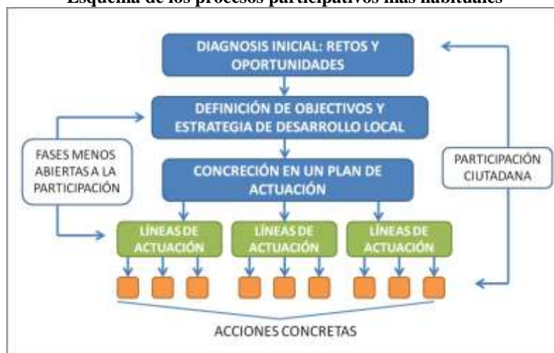
Figura 3. Esquema de los procesos participativos más habituales

- Planes en los que la participación ciudadana es efectiva durante toda la vigencia del proyecto, desde la fase de gestación, la puesta en marcha de las actuaciones, la evaluación continuada y seguimiento, hasta la conclusión y evaluación final.