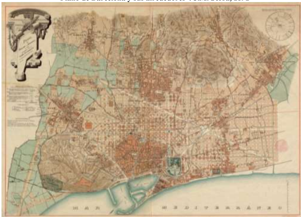
Figura 3. “Plano de Barcelona y sus alrededores”. J.M. Serra, 1891