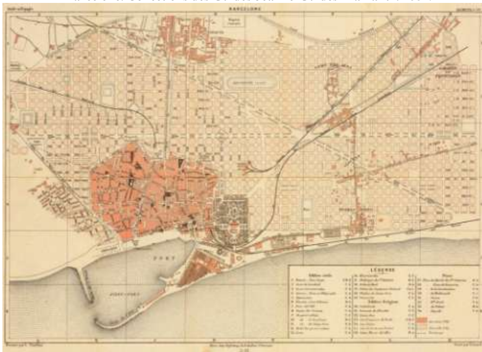
Figura 2. “Barcelone. Collections des Guides Joanne-Guides Diamant”. 1884.

Fuente: Atlas de Barcelona , vol. II, n. 621