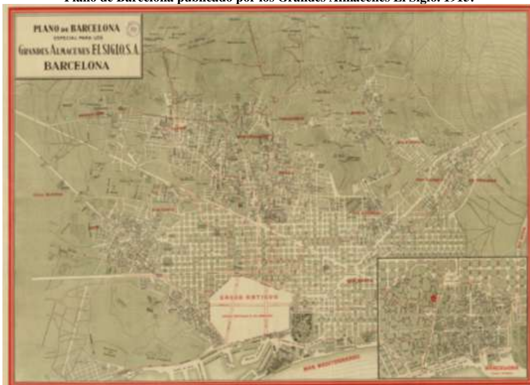
Figura 7 Plano de Barcelona publicado por los Grandes Almacenes El Siglo. 1915.