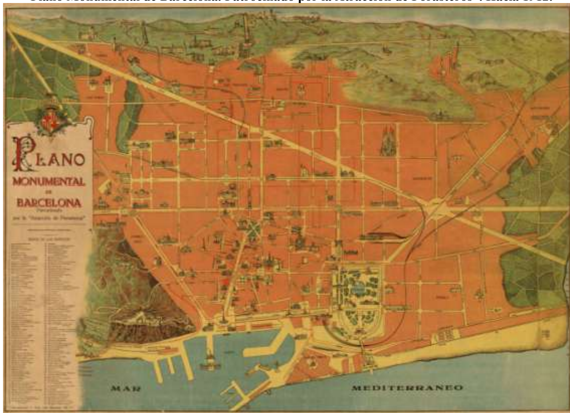
Figura 4. “Plano Monumental de Barcelona. Patrocinado por la Atracción de Forasteros”. Hacia 1912.