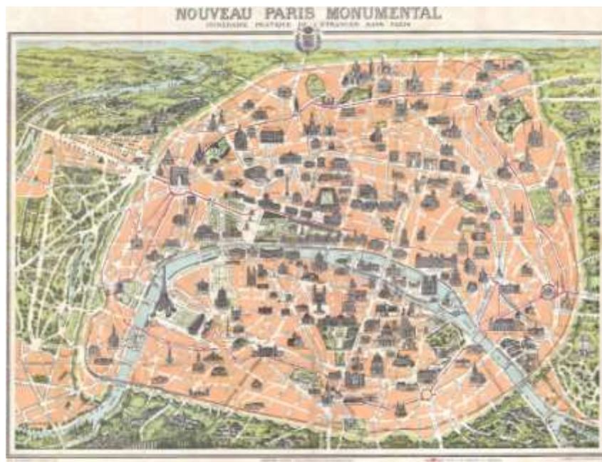
Figura 5. “Nouveau Paris Monumental. Itinéraire pratique de l'étranger dans Paris”. 1910.

El plano merece un análisis pormenorizado. En primer término, el modelo compositivo rompe con el utilizado anteriormente y se adhiere plenamente a la idea de plano monumental al uso en Europa. Es sintomática la similitud existente con el plano monumental de París que se siguió editando, actualizado, a lo largo de las primeras décadas del siglo XX: el “Nouveau Paris Monumental” es el conjunto urbano formado por las grandes vías de la reforma de Hausmann y los monumentos dibujados en volumen, y rodeado por el gran parque del Bois de Boulogne y el entorno verde de las poblaciones rurales de la periferia. De manera intencionada, hay una doble lectura campo-ciudad que deriva en un tratamiento diferenciado de la urbe monumental y de la cintura verde. No deja de ser una visión idealizada de acuerdo con la idea del equilibrio necesario entre el espacio construido y el “cojín” de espacios rurales y naturales para la preservación de la salud pública de los ciudadanos (Fig. 5).