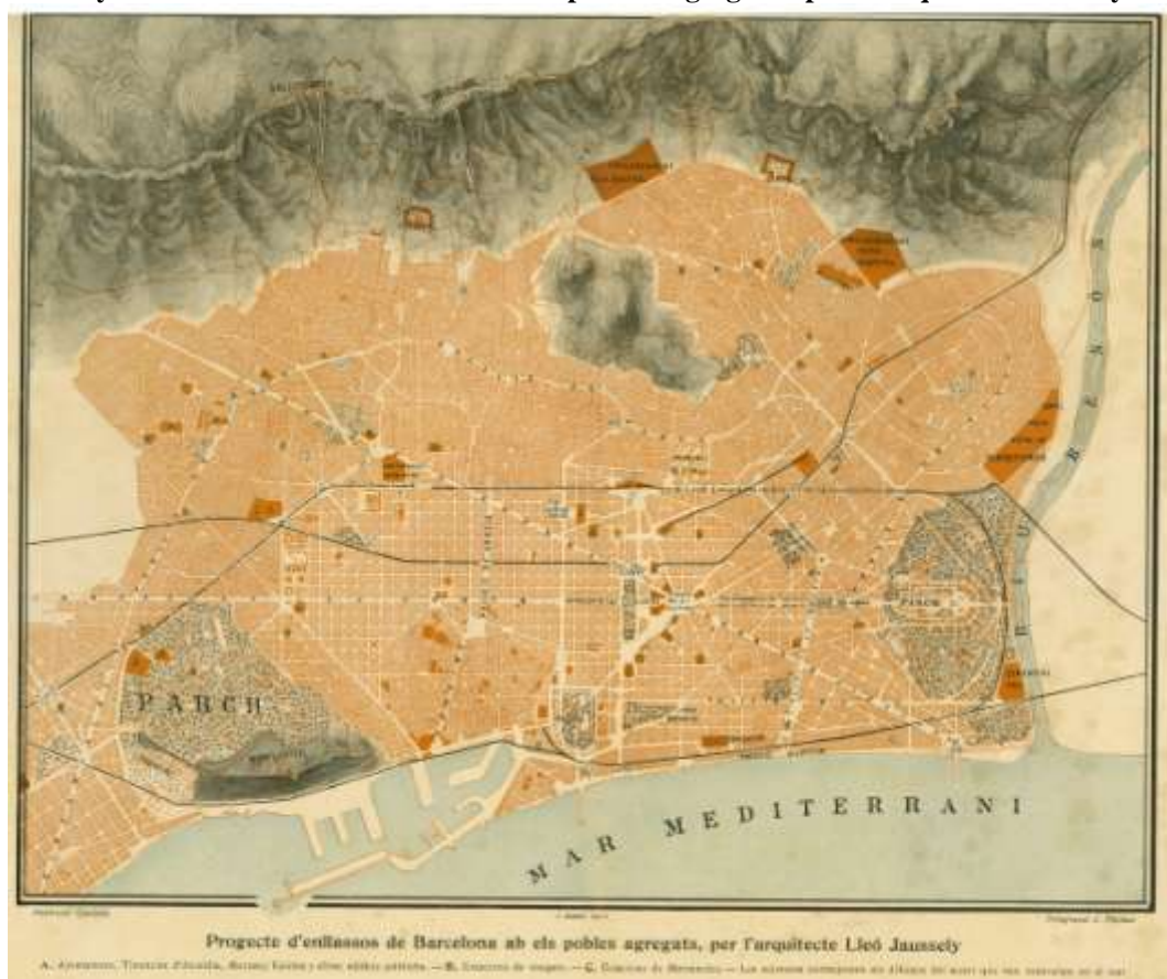
Figura 6. Proyecto de enlaces de Barcelona con los pueblos agregados por el arquitecto Jaussely.