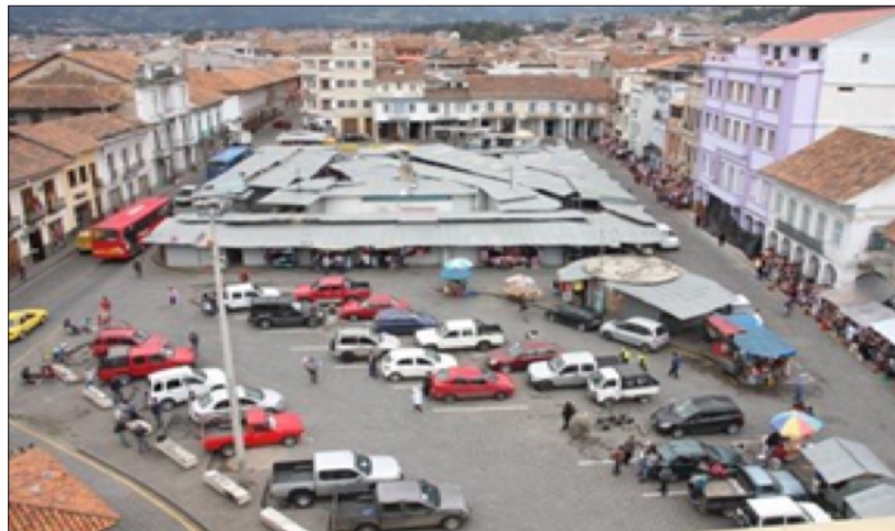
Figura 4. Plaza san Francisco

En total han sido cinco las propuestas de rehabilitación de la Plaza San Francisco que han sido rechazadas por las municipales de turno. En la actualidad, la Empresa Pública de Consultoría y Proyectos de la Universidad de Cuenca (Ucuenca EP) es la encargada de presentar el sexto proyecto con el cual se busca transformar este emblemático espacio 78 . Sin embargo, los comerciantes de la Plaza San Francisco manifiestan su inconformidad y total rechazo ante los diferentes escenarios planteados por la Universidad de Cuenca para la rehabilitación de la plaza, su principal objeción es no haber sido consultados e incluidos en el diseño de este proyecto, por lo tanto no recoge sus principales aportes e inquietudes.