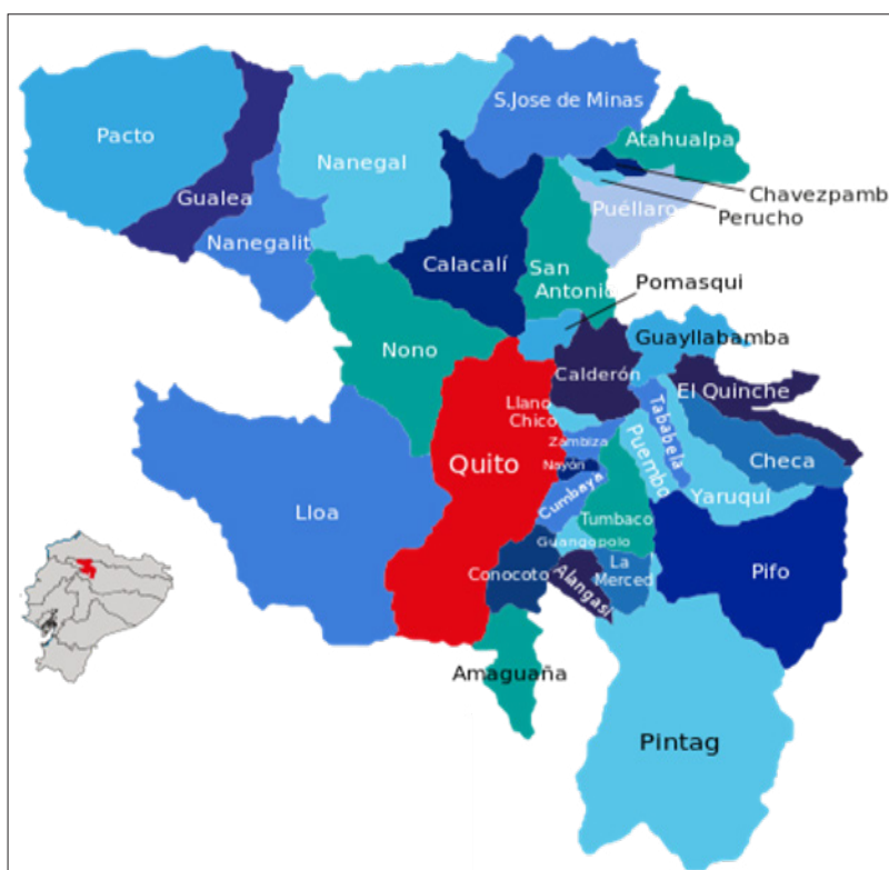
Figura 1. Distrito metropolitano de Quito