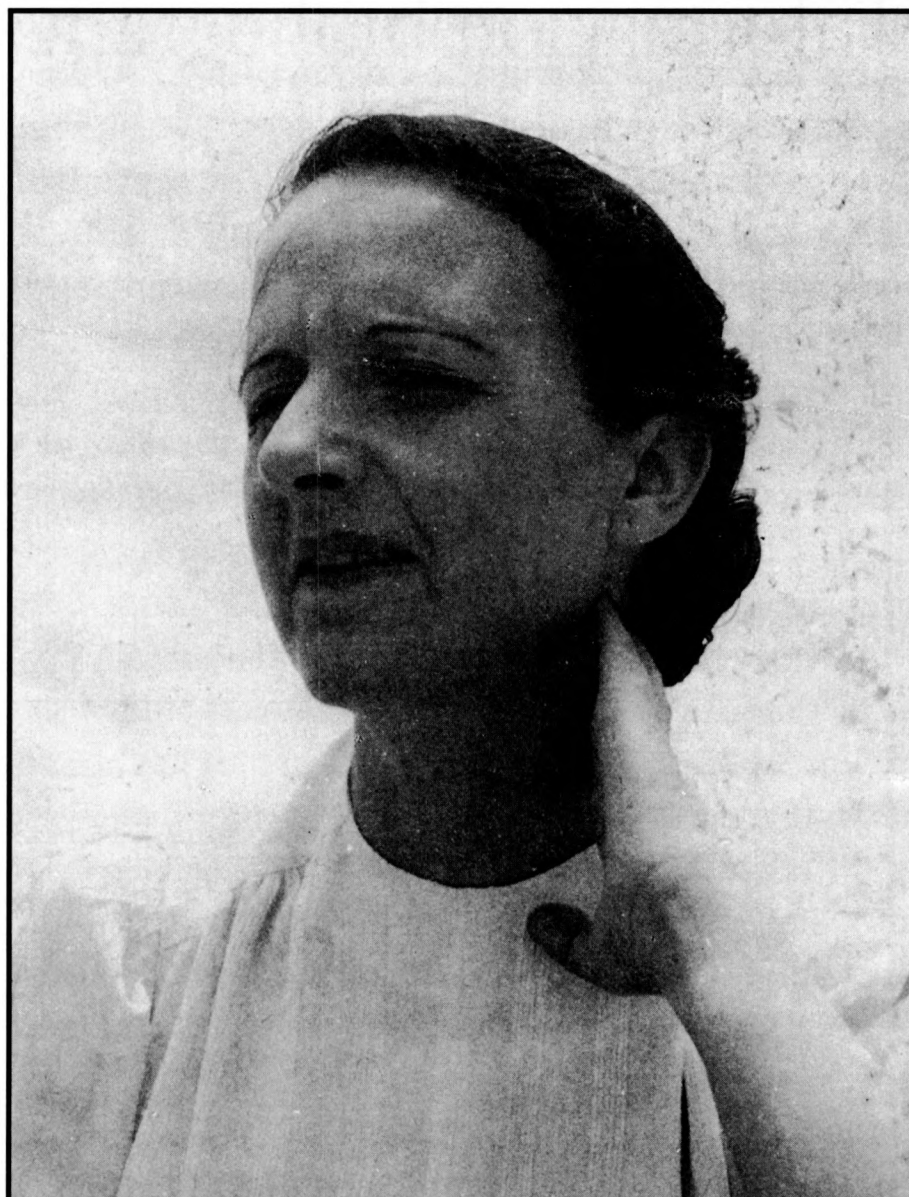
María Zambrano, La Habana, 1960