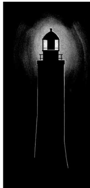
JOAQUIM CANTALOEZELLA: Faro de Ushuaia (Tierra de Fuego, Argentina) . 2007