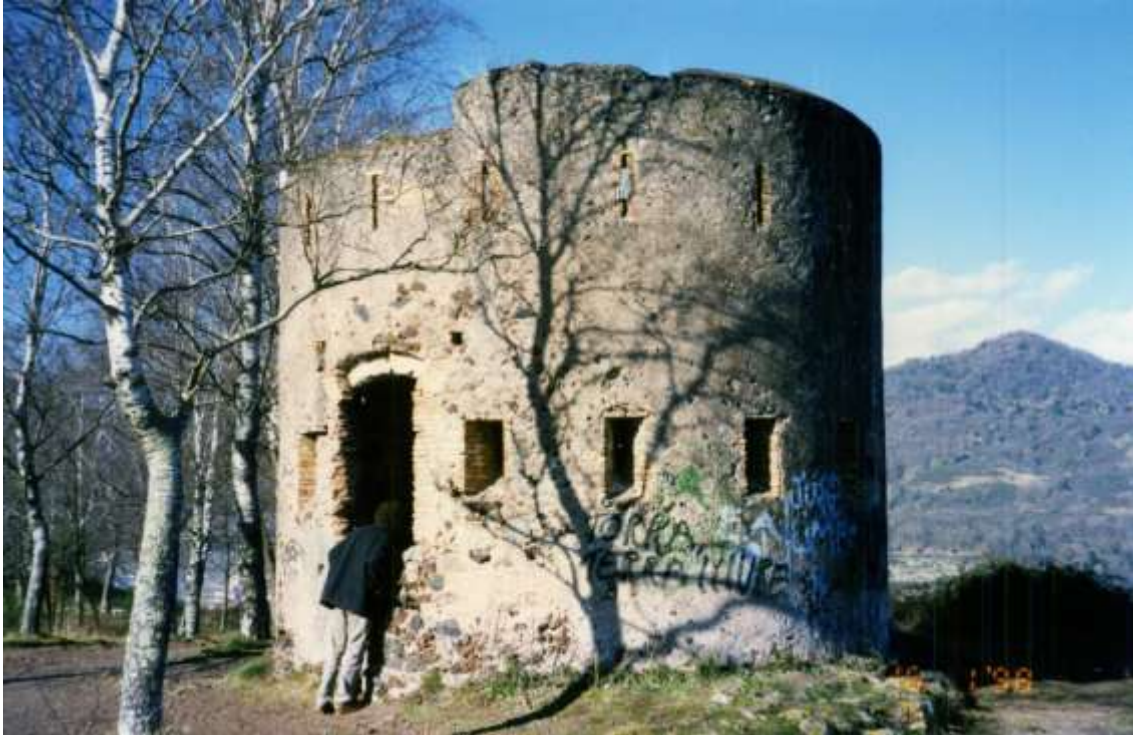
Figura 2: Torre fusellera del Montsacopa d'Olot. Aquest turó domina el nucli urbà de la població, raó per la qual fou fortificat diverses vegades al llarg del segle XIX. En concret, aquesta torre pertany a la fase final del conflicte, no descrita en l'informe transcrit, ja que fou construïda per ordre del general Martínez Campos un cop recuperà la població l'any 1875.

Capitán del Cuerpo D[on] Ramon Bellester 28 dispuso que el Maestro de obras de Gerona 29 trasladándose a la dicha Villa practicase el correspondiente [2] reconocimiento que poco después ratificaron el S[eñ]or Coronel Capitán D[on] José Angulo 30 y Teniente D[on] Juan García de la Lastra aprovechando la ocasión de pasar por aquel punto al ser comisionados por el Ex[celentis]imo S[eñ]or General Andía 31 jefe de operaciones de la Provincia con objeto de practicar varios reconocimientos en aquella dirección agregándose a la columna del entonces Coronel Cabrinetti. 32