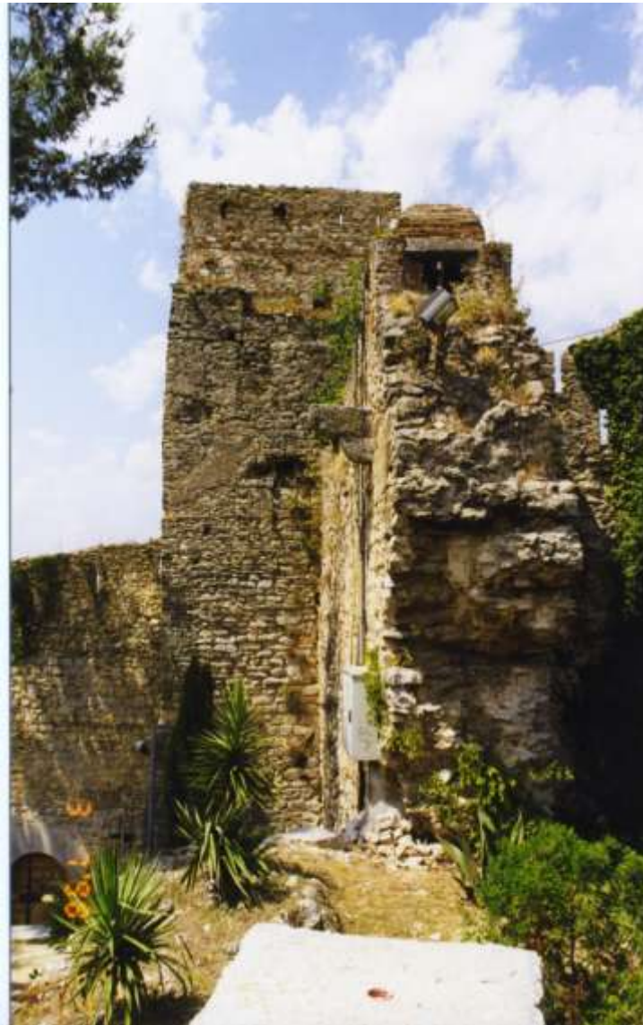
Figura 4: Torre del Telègraf de Girona. Aquesta antiga torre medieval ja havia estat utilitzada durant la Guerra dels Matiners per posar-hi un telègraf òptic de la línia militar. Ara es reforçà amb un parapet espitllerat, com es pot observar a la fotografia. Aquest fou eliminat en una recent i abusiva restauració que obvià tot elements posterior al segle XV.

Pero con motivo de los sucesos de Igualada y de Alpens el pánico se apoderó de las poblaciones y las Autoridades civiles y populares de Gerona solicitaron del Ex[celentísimo]mo S[eñ]or Gobernador [45] Militar Brigadier Reyes permitiese la creación de una junta de armamento y defensa presidida por dichas autoridades, para la que se sirvió nombrarme. En ella se formaron diferentes comisiones y de la de fortificación tomé la presidencia.