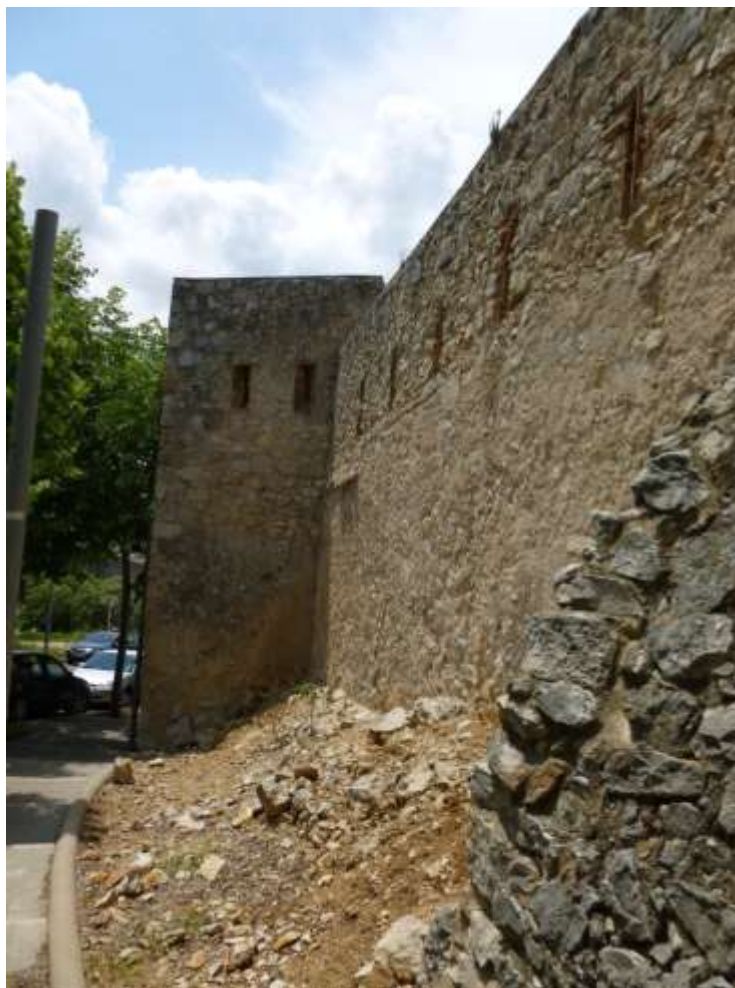
Figura 5: Mur espitllerat bastit a la segona meitat del segle XIX, en traslladar-se el Govern Militar de l'edifici de Sant Martí —seminari de la diòcesi— a Sant Domènec —antic convent desamortitzat— Amb ell es pretenia tancar la bretxa existent al costat de l'esmentat convent de Sant Domènec, provocada per l'exèrcit napoleònic en el moment d'abandonar la plaça a finals de la Guerra del Francès (Arxiu fotogràfic del Servei de Monuments de la Diputació de Girona).

La antigua fortificación de Gerona consistía en un recinto antiguo con torreones que encierra la parte de población baja, a la que se agregó después cinco baluartes con flancos retirados. 67 El mismo recinto seguía encerrando todo el resto de la ciudad flanqueándose unas veces mutuamente y otras conseguido por torreones, menos una parte, la de S[an] Pedro, que no lo estaba.