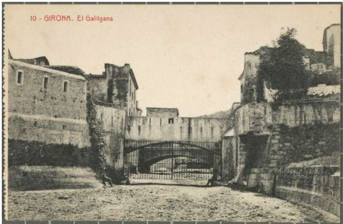
Figura 6: Fortificacions bastides a la desembocadura de la riera Galligants l'any 1874. Aquest sector havia quedat molt enderrocat com a conseqüència de les inundacions que afectaren el barri de Sant Pere l'any 1843, de manera que calgué reconstruir-lo en bona part. S'ha de destacar la porta reixada que es posà per així privar l'entrada a la vila però, alhora, en cas d'inundació sobtada, fàcil d'obrir (Arxiu Municipal de Girona).

del Oñá hasta la desembocadura [52] del Galligans; dos en la puerta de San Cristóbal para flanquear el lienzo de muralla que limita la Catedral y otra para batir la altura de Puig den Roca y a metralla el curso superior el Galligans.