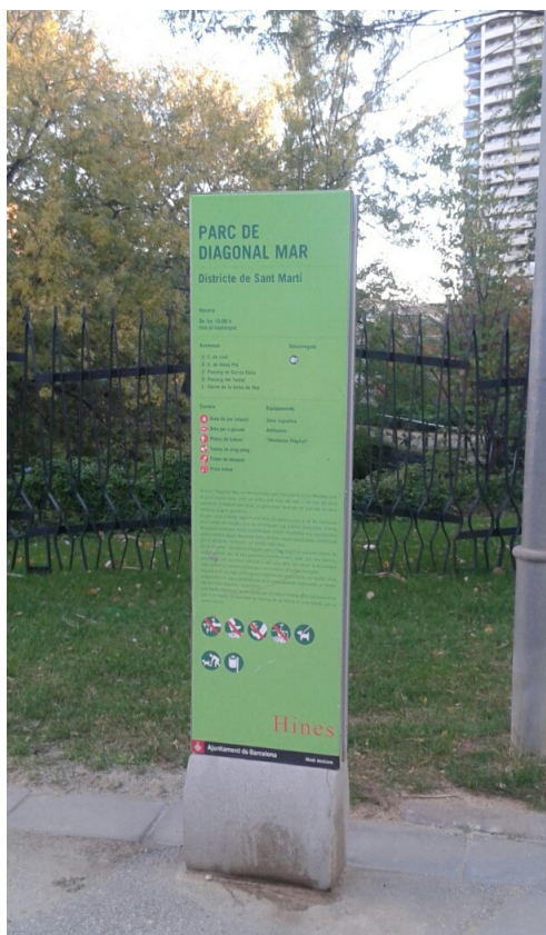
Figura 1. Señalética del P. Diagonal Mar donde aparece la empresa que urbanizó la zona, HINES

al Poblenou como “la principal plataforma económica y tecnológica de Barcelona, Cataluña y España, en la perspectiva del Siglo XXI” 65 . Ahora bien, como señalara el antropólogo Isaac Marrero 66 , el 22@ no pretendía otra cosa que impulsar el paso “desde un modelo de producción industrial-fordista a uno flexible-postfordista”, facilitando la implantación de nuevas empresas mediante la creación de infraestructuras y equipamientos, así como apoyo público en aspectos vinculados a la investigación y la transferencia de tecnología.