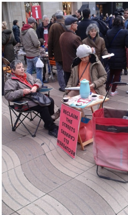
Figura 8. Participantes de la Ocupación popular de las Ramblas desayunando, enero 2017

Otra de las alternativas planteadas por la plataforma fue la de las apropiaciones momentáneas, insolentes 90 , de zonas muy disputadas, como la Rambla del barrio.