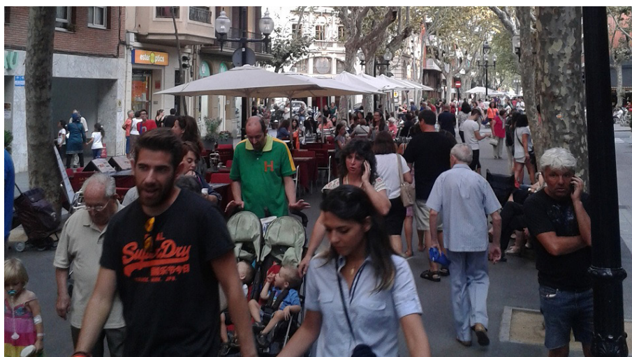
Figura 4. Rambla del Poblenou poblada de terrazas y paseantes en el verano de 2014

Fem Rambla se muestra así como un actor que enfrenta la privatización –en forma de desposesión de los espacios colectivos- que supone la proliferación de las terrazas desde un punto de vista agónístico 74 , esto es, de confrontación de un proyecto de carácter neoliberal para el barrio que se presenta como hegemónico 75 . Sin embargo, también habría que señalar que su propuesta alternativa, esto es, incrementar los ámbitos de decisión vecinal en los asuntos que conciernen al barrio, parecen enfrentar este proceso de desposesión únicamente mediante alternativas de radicalización democrática, incidiendo en aquello que autores como Manuel Delgado denominan “ciudadanismo” 76 y que se mostrarían como un intento por humanizar el capitalismo. No obstante, como señalan algunos autores, aunque la sociedad postcapitalista debe ser alcanzada siempre desde la democracia, el nuevo mundo de ser siempre “sin capitalismo y no [...] con un capitalismo diferente” 77 .