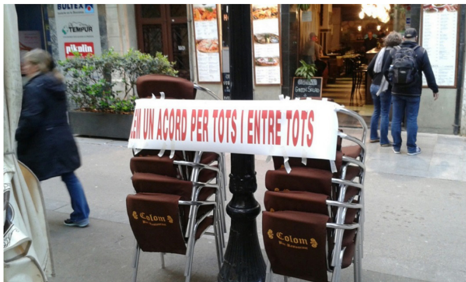
Figura 6. Lock out de bares y restaurantes en la Rambla del Poblenou, abril 2013

meras acciones planteadas por el grupo se encontró la ocupación simbólica, un mes después, de un solar del barrio junto al que estaba previsto la construcción de dos hoteles.