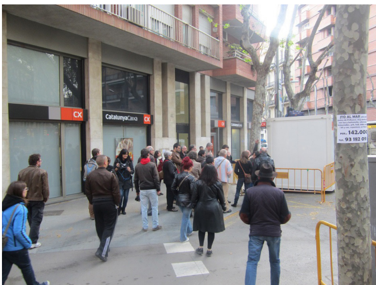
Figura 3. Vecinos y vecinas del Poblenou paralizan las obras de la Rambla en abril de 2013

solicitar al Distrito la paralización total de la obra y la puesta en marcha de un proceso participativo que permitiera decidir qué tipo de Rambla se materializaría en colaboración con los vecinos y vecinas. Sin embargo, y pese a la solicitud realizada, el siguiente día 10, los obreros de la empresa se dispusieron a comenzar unos trabajos que, finalmente, serían paralizados por la acción vecinal (figura 3). Comenzaba así Fem Rambla , proceso que propondría los objetivos de: definir de forma participativa cómo había de ser la remodelación de la Rambla; establecer qué usos habían de convivir en ella y cómo hacerlos compatibles; empoderar al vecindario en la toma de decisiones, y establecer una metodología participativa que sirviera de enlace regular entre el Distrito y el propio barrio 73 .