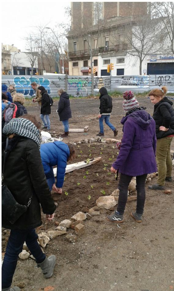
Figura 7. Constitución del Huerto de La Vanguardia, enero 2017

reivindicar los espacios, los espacios urbanos, apropiarnos de ellos. El lema es 'solar abandonado, solar okupado'. En el Poblenou hubo un plan urbanístico, el 22@, que surgió en épocas de bonanza, de vacas gordas, y claro... era para oficinas de alto standing, hoteles... y en este plan no se toma en consideración la gente del barrio [...]. Estamos en derecho de okupar un espacio que no tiene vida y nosotros cambiamos esto dándole vida