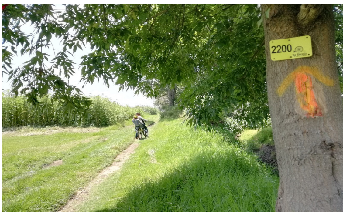
Figura 3. Indicadores extramuros para los cicloturistas de Val'Quirico.

En definitiva, si retomamos, esta vez desde otro punto de vista, el análisis de la caracterización de Val'Quirico como residencial cerrado con un centro comercial en su interior, encontramos que en los límites del enclave no existe ningún establecimiento comercial comúnmente conocido como tradicional , es decir, que atienda a las necesidades básicas de alimentación, vestimenta, educación y salud de los posibles vecinos. En otras palabras, todos los establecimientos comerciales ubicados en los límites del complejo pueden ser catalogados como de “alto impacto”, esto es, que por sus características pueden provocar “transformaciones, alteraciones o modificaciones en la armonía de la comunidad”, entre otros, restaurantes, establecimientos de hospedaje y locales para la venta y/o distribución de bebida alcohólicas 37 .