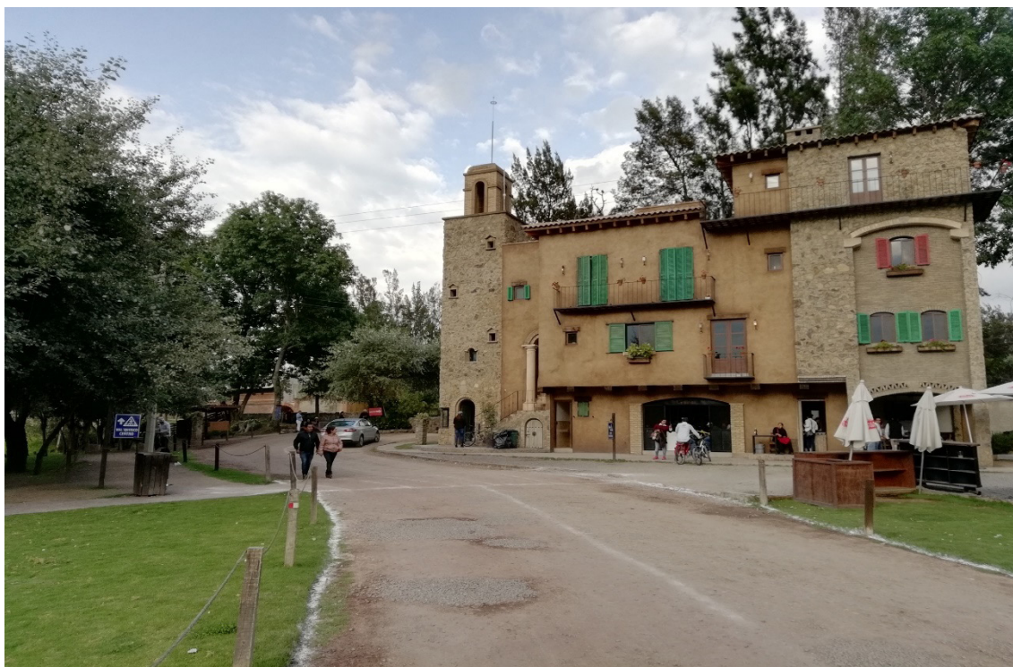
Figura 2. Edificio tradicional toscano en Val'Quirico.

En este punto, los autores nos proponemos describir e interpretar los principales elementos a través de los cuales reconocer Val'Quirico simultáneamente como gated community , open-air shopping mall y enclave artificialmente turistizado. En última instancia, tal caracterización pretende articular un constructo teórico que permita un análisis riguroso del fenómeno: la comunidad-consumo o consumidad .