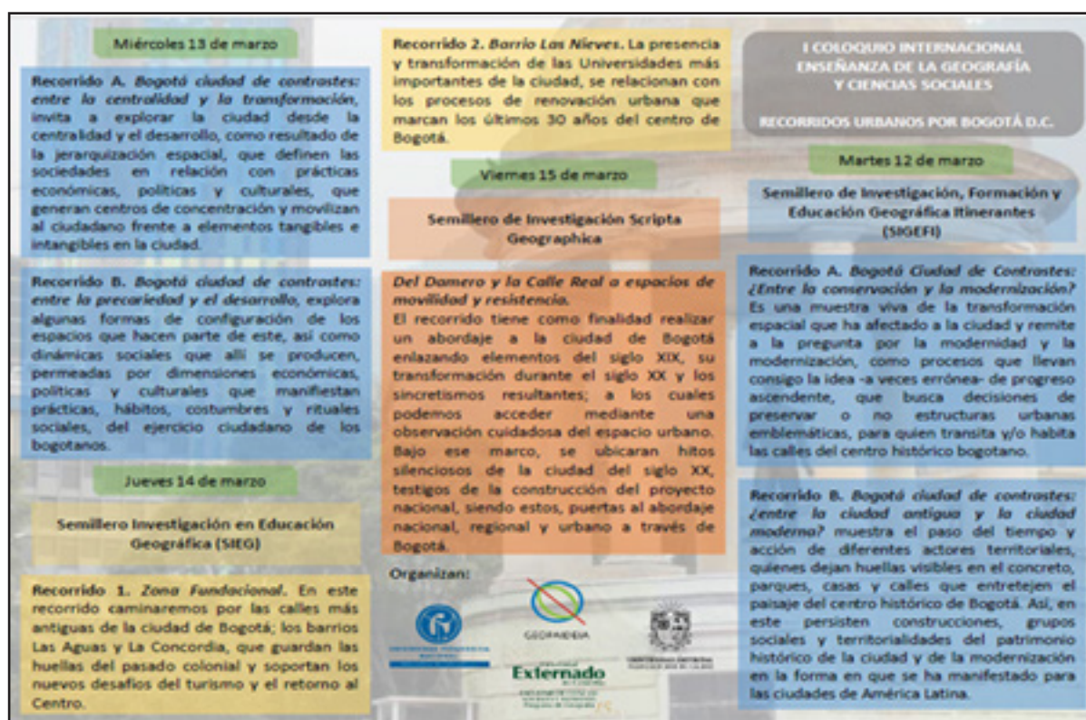
Cuadro 3. Itinerarios urbanos en el centro histórico de Bogotá

Las sesiones académicas se organizaron en mesas de debate, constituidas por ponencias centrales y comunicaciones breves. Las ponencias centrales habían sido redactadas por las personas del Consejo Directivo del Geoforo y se difundieron entre los/las asistentes antes del 5 de febrero de 2019. Es decir, dos de los miembros del Consejo Directivo, presentaron una ponencia central como síntesis del debate y abrieron el mismo con tres o cuatro preguntas. La exposición se realizó en un tiempo inferior a 30 minutos, con un texto entre tres y cinco páginas. Esta dinámica favoreció la participación de las personas asistentes a cada sesión.