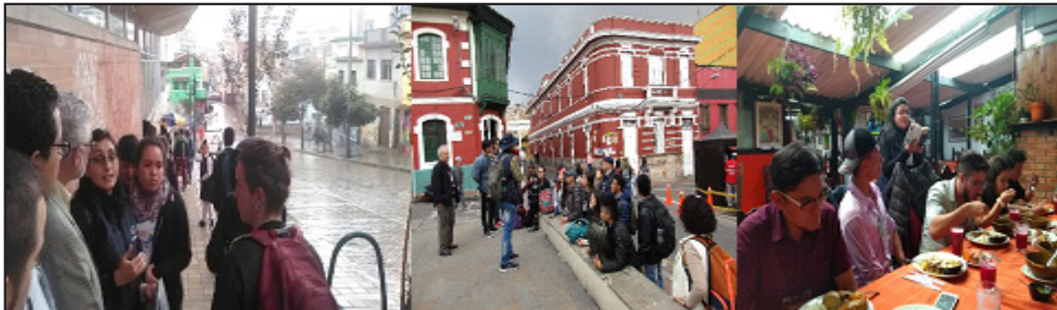
Figura 1. Recorridos urbanos centro de Bogotá (Semillero SIFEGI)

Los recorridos toman como pretexto el centro histórico de la ciudad, para reconocer contrastes, contradicciones, transformaciones físicas, históricas, administrativas, funcionales y simbólicas en el mismo. Para ello, se realizan caminatas (figuras 1 y 2) cuyas explicaciones durante el recorrido y paradas estratégicas, permitían a los participantes reconocer construcciones, usos y prácticas sociales, como parte de la definición del patrimonio en el centro de Bogotá.