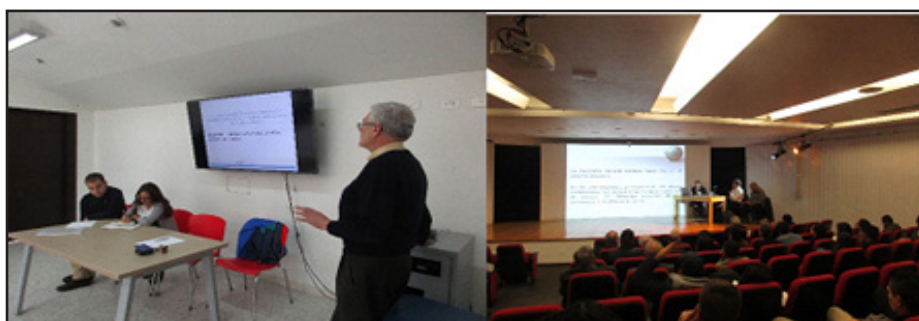
Figura 3. Sesiones académicas complementarias

Otro escenario de intercambio se produjo en las sesiones académicas programadas, lunes y martes, en la Universidad Distrital Francisco José de Caldas y el Planetario de Bogotá respectivamente (figura 3). La primera denominada “La educación geográfica que nos convoca”, contó con la participación de tres colegas, dos de España y una de Colombia.