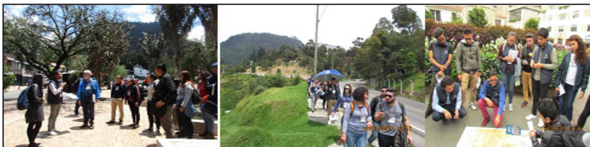
Figura 2. Recorridos urbanos centro de Bogotá. (Semilleros SIFEGI, SIEG y Scripta Geographica)