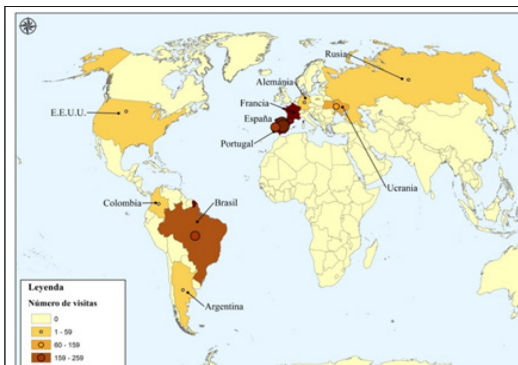
Figura 4. Visitas por países a la sección de Foros. Abril 2018