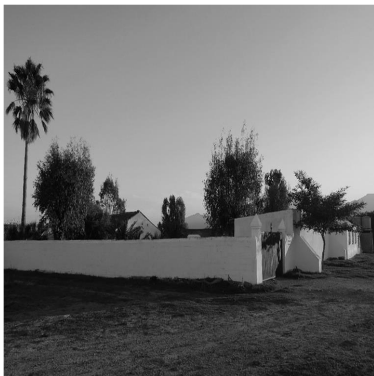
Figura 6. Cortijo de Tinoco