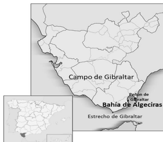
Figura 1. Localización del área de estudio.

Entre las reacciones más sobresalientes destacaron la redistribución de la población local, la dispersión del hábitat y la creación de nuevos núcleos de poblamiento: cortijos, ventas, etc.; y, lógicamente, toda una reordenación militar del territorio desde entonces denominado Campo de Gibraltar, comarca de la actual provincia de Cádiz (figura 1).