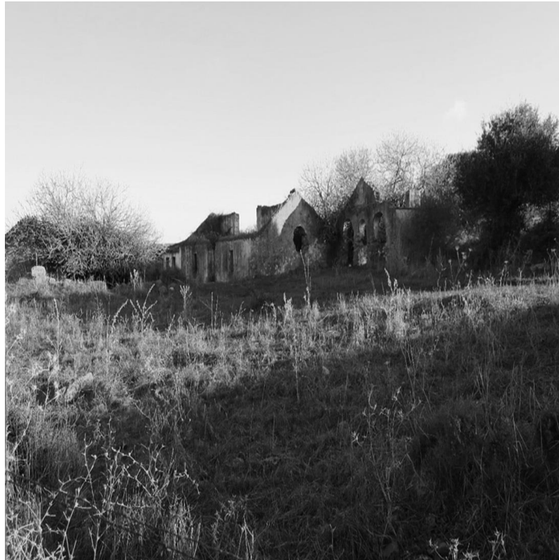
Figura 5. Cortijo de Albalate. Vista general

La tranquilidad y soledad actual del asentamiento resultan ideales para trabajar con un grupo de estudiantes o visitantes cuestiones relativas a la interpretación del espacio geográfico, así como otras relativas al urbanismo.