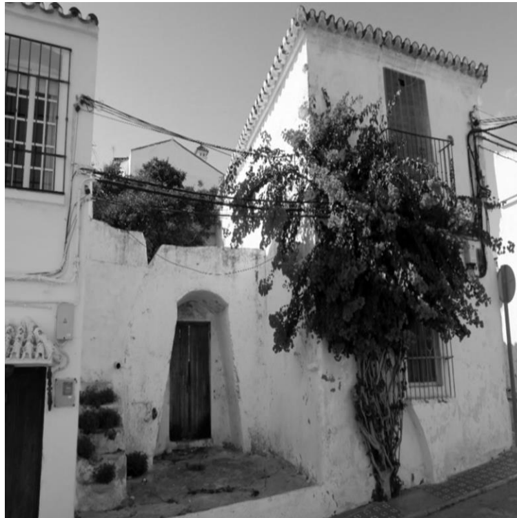
Figura 4. Venta del Guadiaro, fachada principal y puerta de entrada.

En la propia Venta de Guadiaro se puede comenzar la visita por la Plaza central (Plaza de los Zafiros) donde se construyeron catorce viviendas para acoger a exiliados de Gibraltar. Junto a la plaza se conserva la calle Posada y el edificio de la Venta (figura 4).