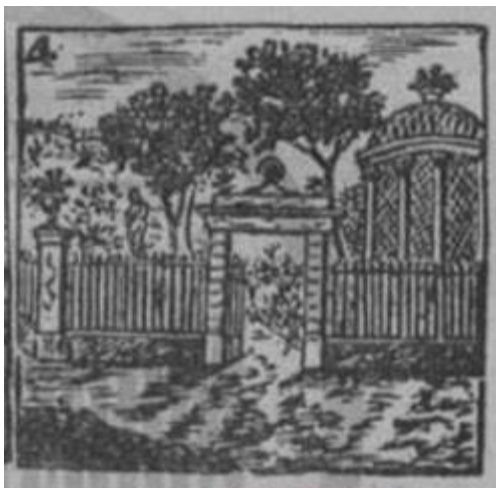
Figura 5. Jardí del General. Dibuix de l'auca Edificis antics de Barcelona .

El jardí va anar desapareixent a partir de 1872 a conseqüència de la nova urbanització projectada per a la construcció del Parc de la Ciutadella i els entorns del carrer Comerç i passeig de Picasso. El darrer reducte va desaparèixer el 1874, amb motiu de la finalització del sector de l'entrada del Parc (Figura 5).