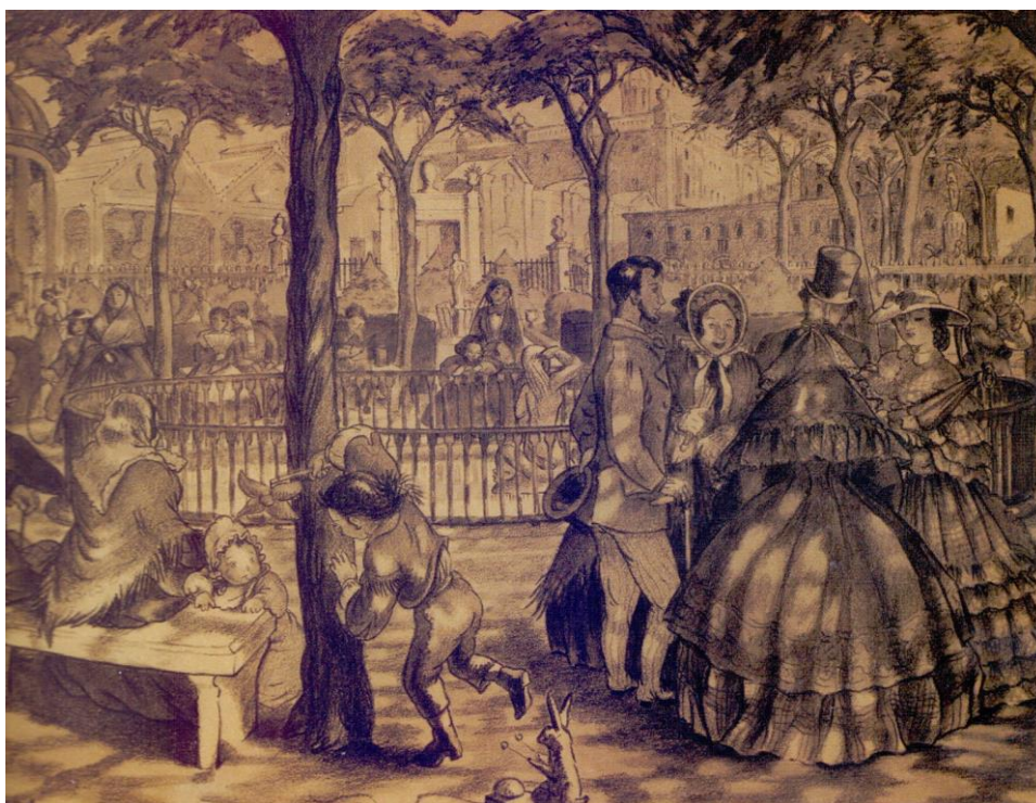
Figura 6. Jardí del General