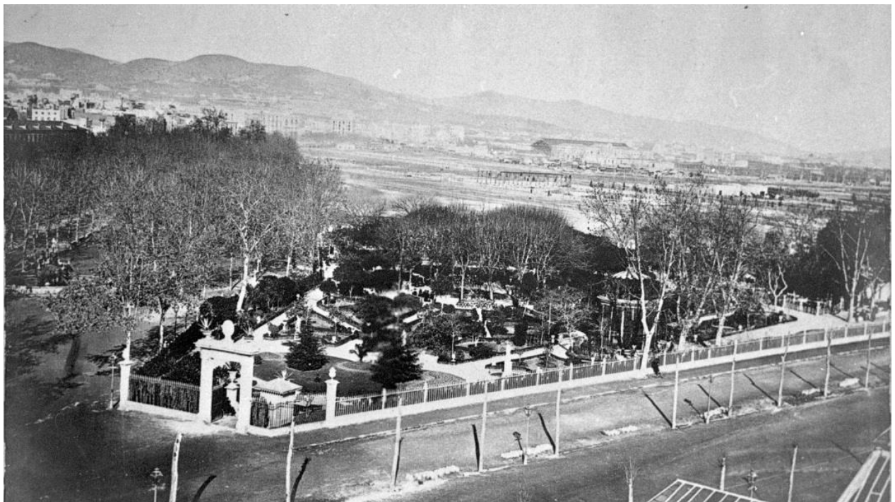
Figura 3. El Jardí del General l'any 1870 (avui, part del Parc de la Ciutadella)

Més enllà, al centre, hi havia un estany circular més gran amb l'escultura d'una nàiade de marbre asseguda sobre un gran peix 17 . Les nàiades són divinitats menors de la mitologia grega que personifiquen l'aigua de brolladors, llacs i fonts. L'estany estava tancat per una barana baixa de ferro de trenta-set vares de circumferència i dotze de diàmetre, i un joc d'aigua al centre. Al seu voltant es distribuïen setze pilars amb testos de roses de Bengala i vuit bancs de marbre blanc que destacaven davant d'una plantació circular de xiprers que els feien de respallier. 18 Cal interpretar que la presència d'aquestes varietats de rosers al jardí i a l'espai públic de Barcelona era una distingida novetat (Figura 3).