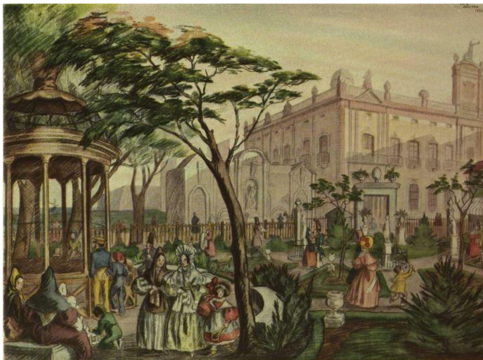
Figura 1 El Jardí del General. A la dreta, el Palau de l'antiga Duana. Composició de Lola Anglada.

cas de Barcelona, capital de Catalunya, aquesta competència es projectava especialment sobre el seu espai públic.