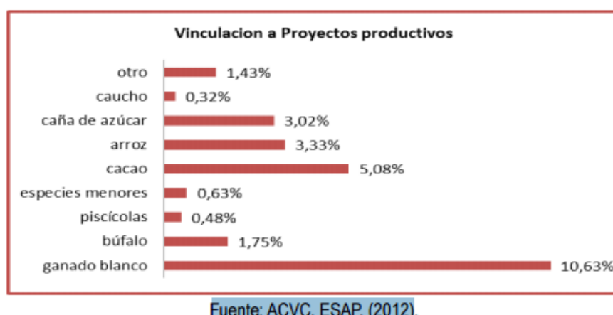
Figura 1. Vinculación a proyectos productos ZRC del Valle del río Cimitarra

Además, es necesario señalar que este territorio es bastante apetecido por empresas dedicadas a la actividad minera y petrolífera por lo cual el estatus de Reserva se convierte en constante obstáculo para la realización de estos megaproyectos y para el interés mismo de los gobiernos que tienen fijados sus intereses en impulsar la economía por medio de la inversión de estos capitales.