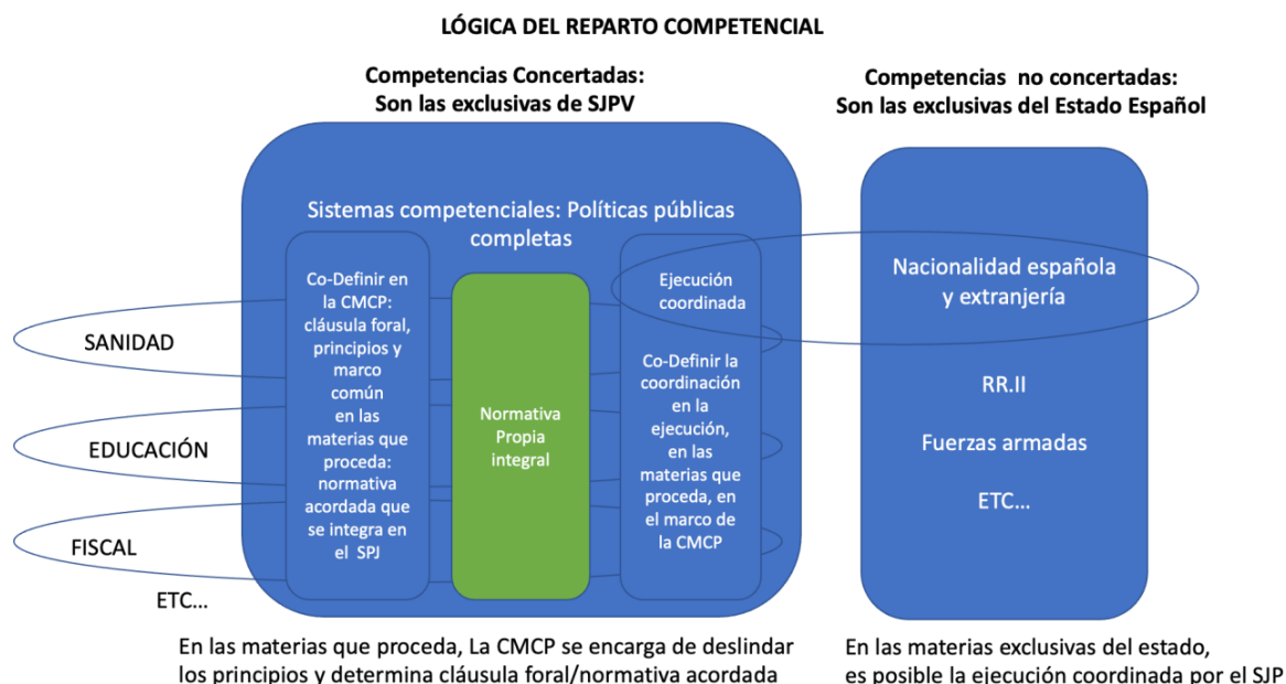
Figura 3. Lógica del Concierto Político en el TAEHB.

Así, el TAEHB en su artículo 85 distingue dos tipos de competencias: