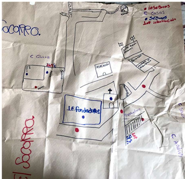
Figura 2: Cartografía barrio El Socorro.