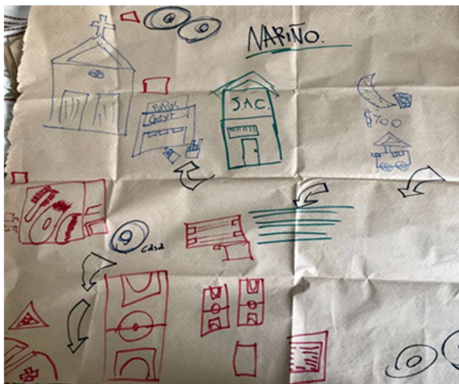
Figura 4: Cartografía barrio Nariño