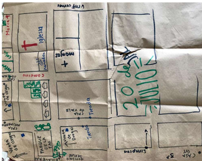
Figura 3: Cartografía barrio 20 de Julio