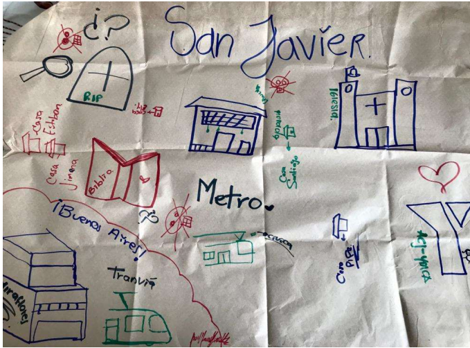
Figura 5: Cartografía barrio San Javier.