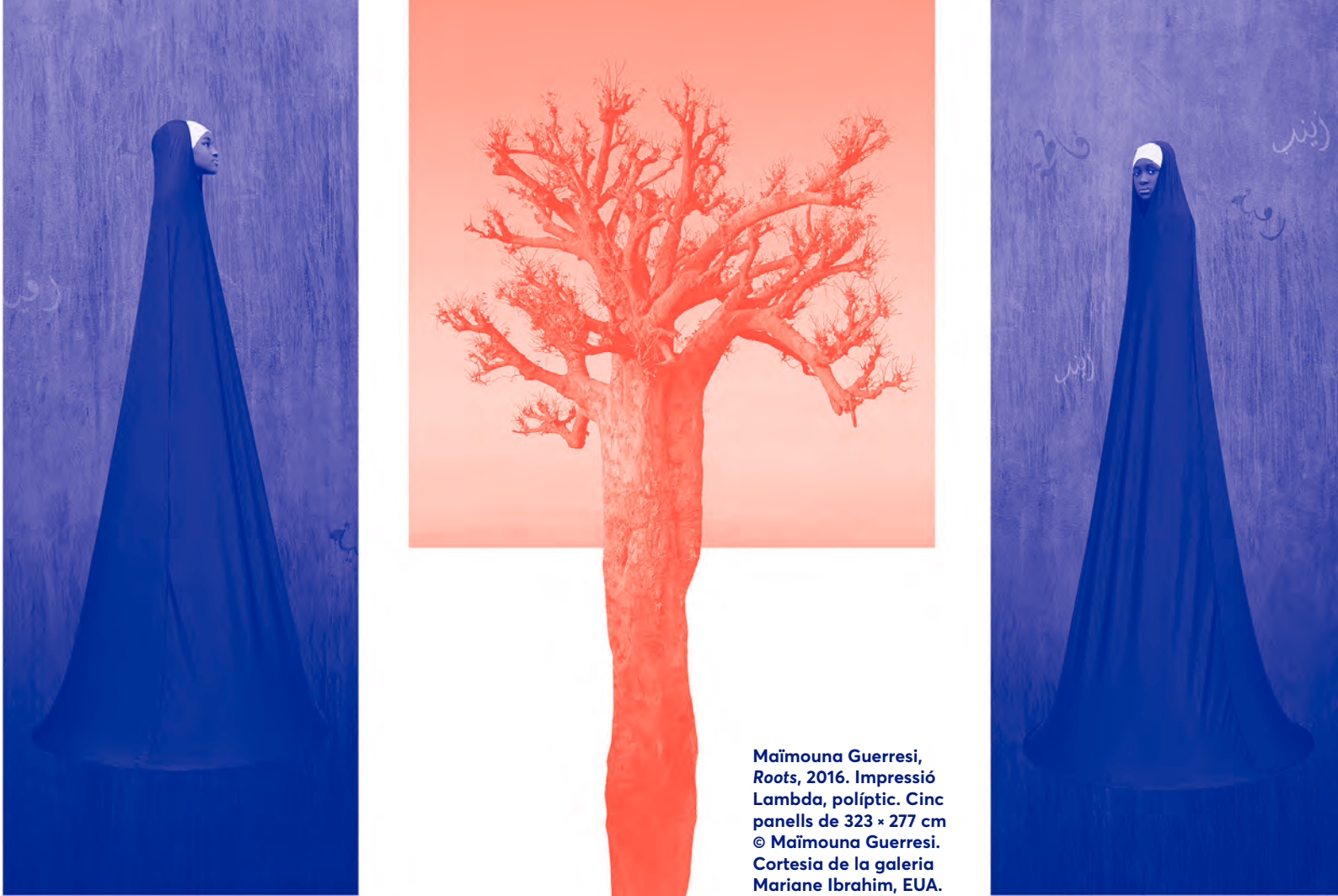
Maïmouna Guerresi, Roots, 2016. Impressió Lambda, políptic. Cinc panells de 323 x 277 cm © Maïmouna Guerresi. Cortesia de la galeria Mariane Ibrahim, EUA.

simples i geomètriques que comporten un equilibri psicològic i que ens remetent a la noblesa solemne de les madones velades de la pintura renaixentista.