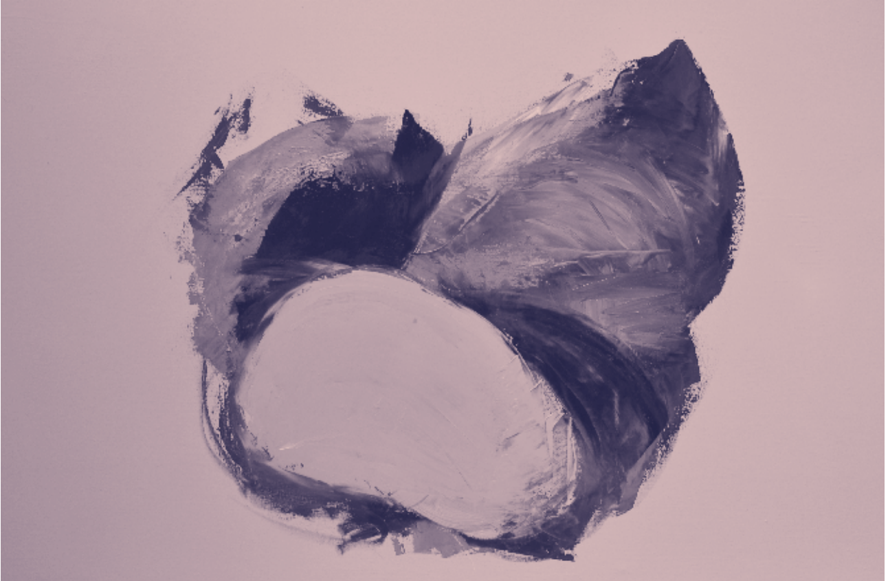
Carme Porta, Purament-Impurs I (2019). Oli sobre tela, 89 x 146 cm.

Ens preguntem: per què ens continua interessant el bodegó avui en dia? Probablement perquè parla de l'única certesa que tenim: de la nostra caducitat i d'un rellotge biològic que no s'atura ni un instant. El present, com anuncia Michel Onfray, «també està subjecte a la llei del temps, sembla, evidentment, només un moment furtiu en el qual es reproduïx aquesta metamorfosi del futur al passat, ja que tot el passat es converteix en un vell futur. Per aconseguir aquesta fita és necessari passar per la trituradora del present, transformador invisible de l'ésser en no-res» (Onfray, 2018: 44).