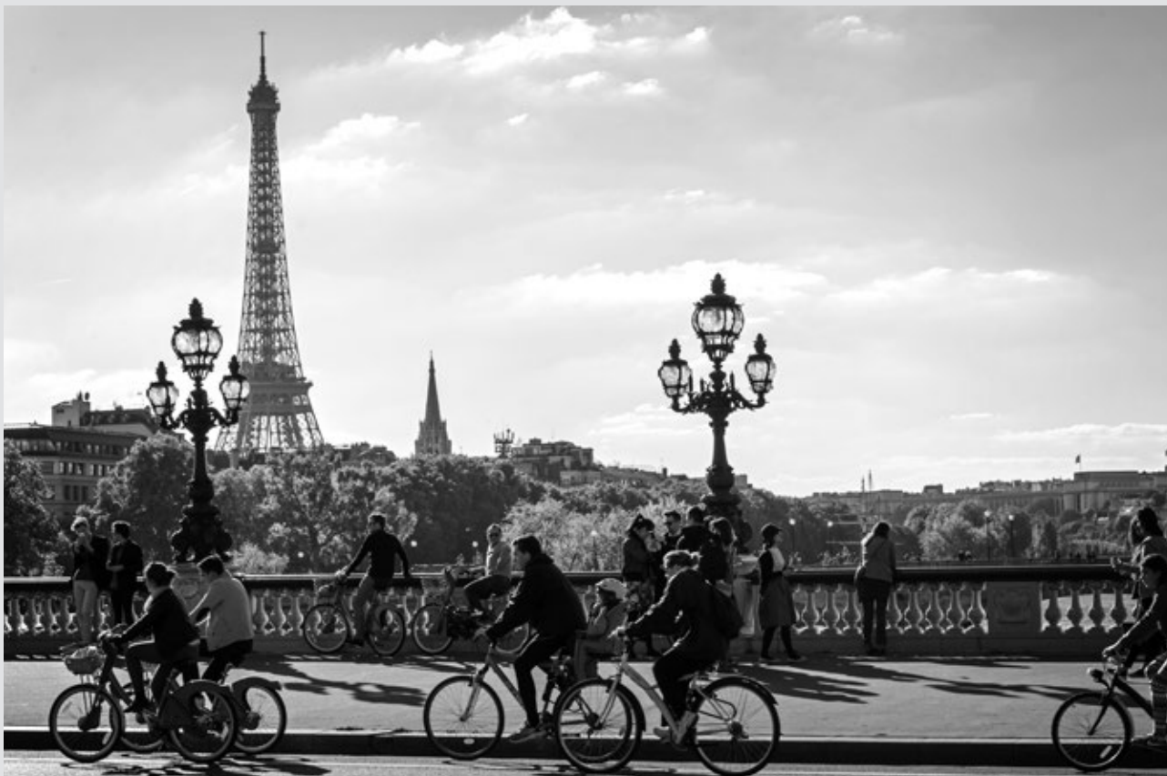
El Sena i la torre Eiffel, dos dels emblemes de París.