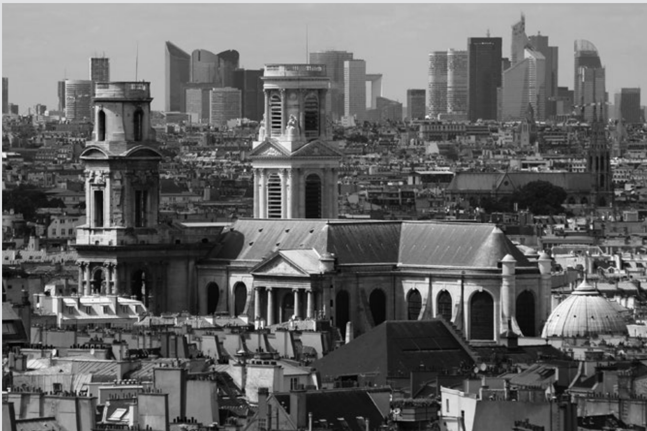
Vista del vell i el nou París, amb l'església de Saint-Sulpice a primer terme i els gratacels de La Défense al fons.

i fa creuar la mirada d'una parella burgesa asseguda en un cafè nou d'un bulevard amb la d'un pare treballador fatigat, acompanyat dels seus dos fills, admirats per l'opulència del local.