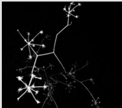
Pàgina 81: Indago 17