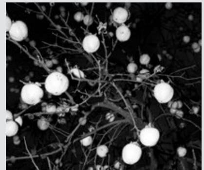
Pàgina 88: Indago 12

Yurian Quintanas (Amsterdam, 1983), tècnic superior en Imatge especialitzat en fotoperiodisme, va completar la seva formació amb fotògrafs de National Geographic tan prestigiosos com Tino Soriano i Annie Griffiths Belt. El 2007 va començar a treballar en projectes personals i a desenvolupar una faceta artística que ha dotat la seva obra d'un caràcter propi.