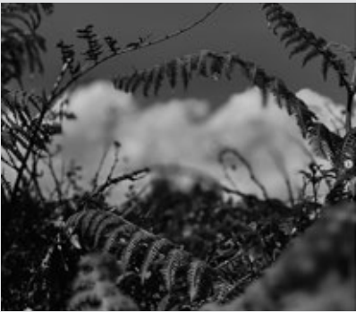
Portada: Unnatural Portraits