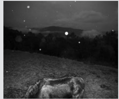
Pàgines 22-23: Rural 23