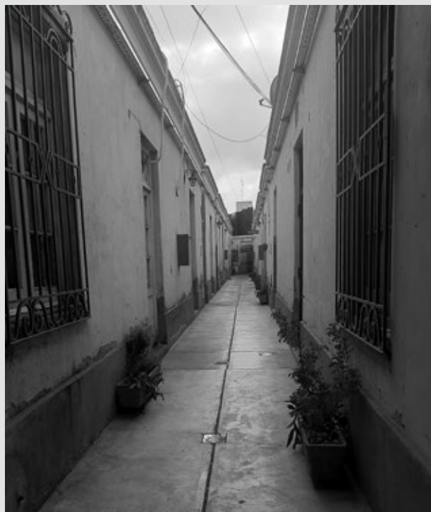
Casa de vecindad, situada a Juan B Justo, 175. Va ser construïda el 1915 i declarada patrimoni cultural de la ciutat el 1991.

Morosi, J. i Vitalone, C. 1988. «La Plata: viejas raíces para una nueva ciudad», Icomos Information , 4/1988.