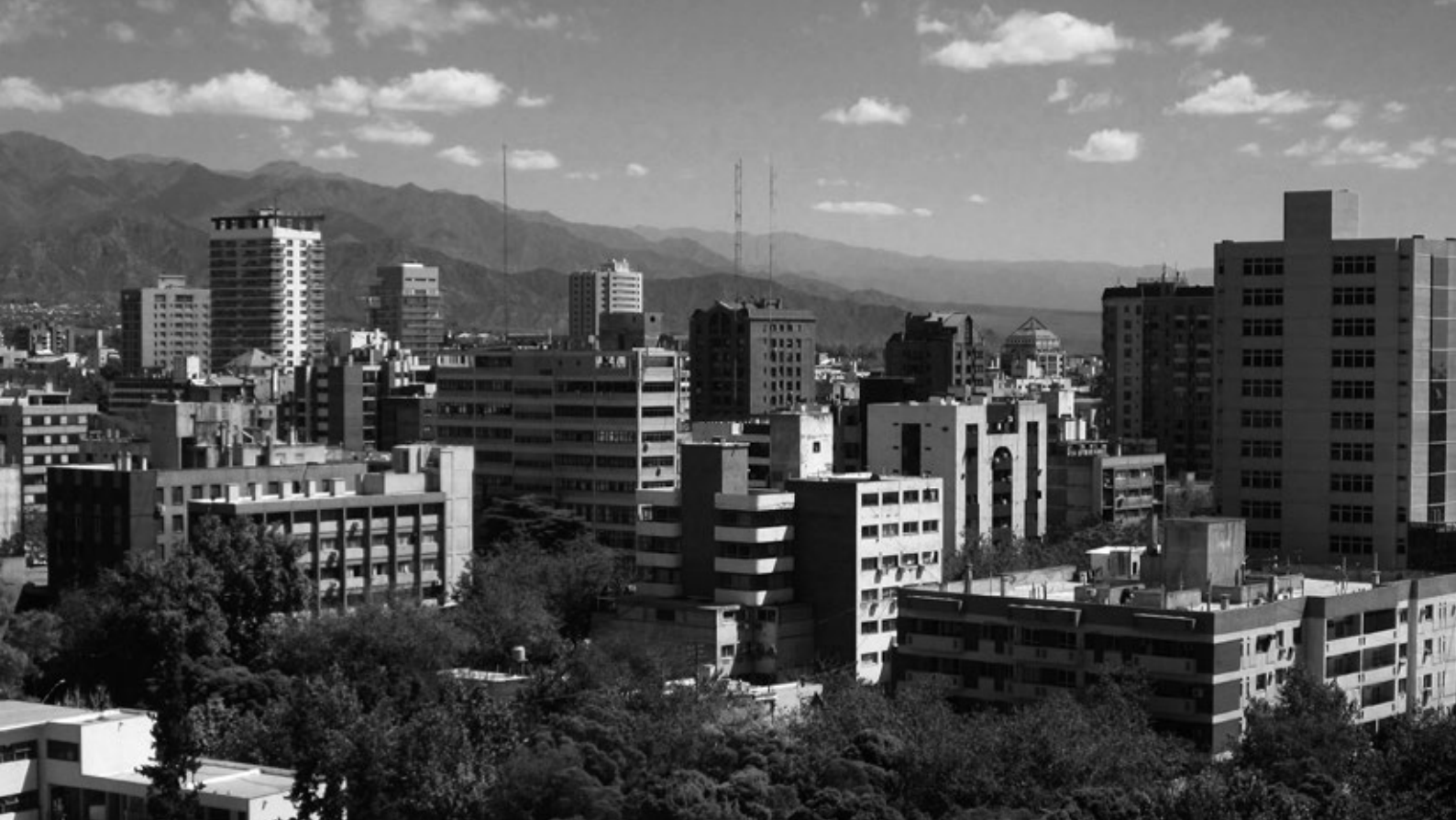
Vista de la ciutat de Mendoza.

Soc de Barcelona i visc a Mendoza , terra de bon vi i porta d'entrada a l'Argentina des del Pacífic. Hi dono classes d'urbanisme a la Universitat Nacional de Cuyo. Si visiteu la ciutat, podreu constatar que els seus habitants n'estan molt orgullosos i sovint destaquen llurs virtuts, en especial la superposició d'arbres, quadrícula i acequias , les tres capes que formen la base de la seva trama urbana. Ara bé, tot i que aquestes traces territorials continuen latents a bona part de tota l'àrea metropolitana (AMM), la tradicional imatge de Mendoza ha començat a formar part del passat. En un context de declivi socioeconòmic lent i sense interrupcions des dels anys quaranta, els mendocinos recorden amb un punt de nostàlgia quan les mestresses de casa sortien a escombrar les voreres cada matí, quan no calia tancar la casa amb clau i quan a les acequias hi corria aigua neta que baixava dels Andes cada primavera.