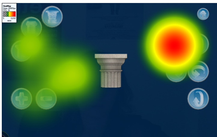
Figura 2. Interfaz de la aplicación de capiteles griegos

Las aplicaciones diseñadas entrarían en la clasificación de “aprendizaje lúdico” y “autoaprendizaje” (Rovelo, 2012), y fueron creadas pensando en su uso en el hogar y/o en el aula. El nivel de interactividad de las mismas era alto (Azuma, Bailot, Behringer, Feiner, Julier&MacIntyre, 2001) ya que no solo proporcionaban información añadida, sino que dejaban al estudiante interactuar con los objetos 3D y 2D de las mismas. Dicha interacción se llevaba a cabo mediante gestos con las dos manos.