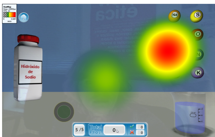
Figura 1. Interfaz de la aplicación de química