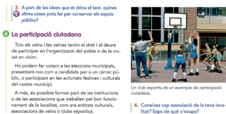
Figura 4. Detalle del libro de texto de cuarto de Educación Primaria de Vicens Vives.