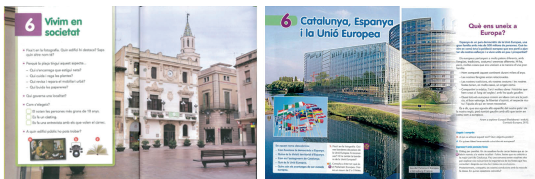
Figura 1. Ejemplo de portadas de la editorial Vicens Vives.

La sinecdoque es analizada desde la semiótica de un modo realmente significativo para el tipo de análisis que se propone. Se considera que esta figura, empleada de manera muy frecuente a nivel visual por la publicidad (Kress y Van Leeuwen, 2001), también ha influido en la construcción de la textualidad verbo-icónica de los libros de texto, la cual construye el significado de términos complejos a través de la representación de una imagen por el todo. A modo de ejemplo, se puede destacar cómo en los libros analizados se vincula de manera directa el Gobierno de Cataluña con la fachada del edificio del Parlament de Catalunya , realizando un vínculo directo con la función del gobierno y su sede institucional, siendo, el uso de las fachadas de edificios institucionales, ya sea a nivel autonómico, estatal o europeo, la imagen más popular para representar casi cualquier alusión a la temática analizada.