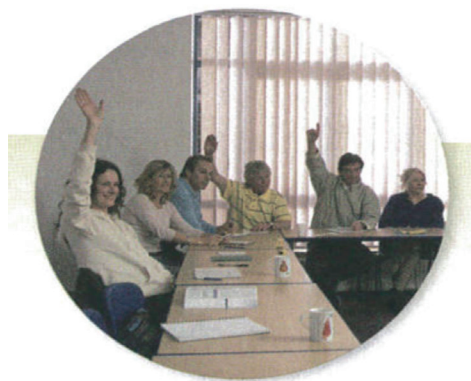
Figura 3. Detalle de una reunión de una asociación de vecinos. Primer curso, Editorial Vicens Vives.

sociedad, mucho más proactiva, a la inclusión de la acción política en el día a día del alumno, que algunos de los títulos expuestos en el ciclo superior como « Les institucions de Catalunya, Espanya i Europa ». Sin embargo, tras analizar estas propuestas a nivel iconográfico, se podría puntualizar que este potencial es desaprovechado mostrando siempre un mismo tipo de imagen, como panorámicas de ciudades y pueblos prototípicos y constantes referencias a las mismas tipologías de profesión continuamente, convirtiendo al barrendero, policía, bombero y bibliotecario en casi la única referencia a profesiones. Pocas son las imágenes que se salen de esta norma. Una de las imágenes que hemos encontrado más interesantes (ver Figura 3), en todo el conjunto de imágenes recogido, pertenece al primer curso de Vicens Vives, introducida en el tema « El poble i la ciutat », en el cual se muestra una reunión de una asociación de vecinos, mostrando al ciudadano en una actividad diferente del trabajo, el derecho al voto o el ocio.