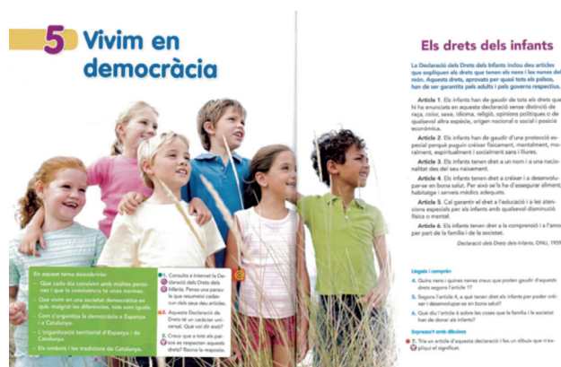
Figura 5. Portada del tema «Vivim en democràcia» de 4º de Primaria de la editorial Vicens Vives.

El uso de la textualidad verbo-icónica se justifica en relación a cómo esta facilita al alumnado el reconocimiento de la temática y asimilación del temario a trabajar. Sin embargo, consideramos que en relación a la creación de conceptos complejos como lo son los introducidos en la temática vinculada al gobierno, reducir todo el conjunto de elementos diversos que componen dichos conceptos en una única imagen, puede proporcionar al alumnado una visión extremadamente simplista y estereotipada.