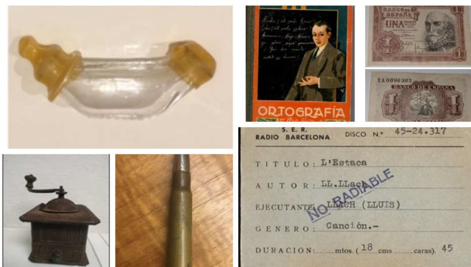
Figura 3. Ejemplos de objetos encontrados en el desván.

Desde la asignatura de Ciencias Sociales, el trabajo se introduce a los alumnos a partir de un soporte digital que muestra los objetos que supuestamente la profesora ha encontrado en el desván de casa de sus abuelos; objetos que los estudiantes del grado de Educación Primaria también pueden encontrar: elementos antiguos como monedas, documentos, fotografías, armas, objetos personales (de aseo, del hogar, de vestuario,...), cromos, mapas, anuncios, películas antiguas, recortes de prensa, carteles, fotos y novelas de antaño, entre otros.