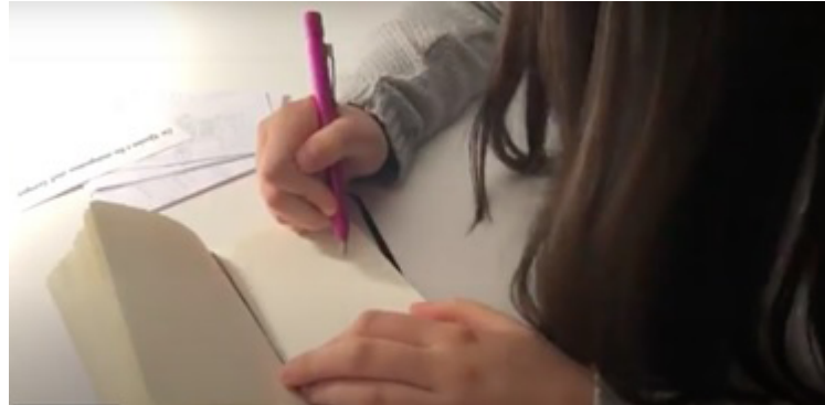
Figura 6. Proceso de creación y redacción de la narrativa.