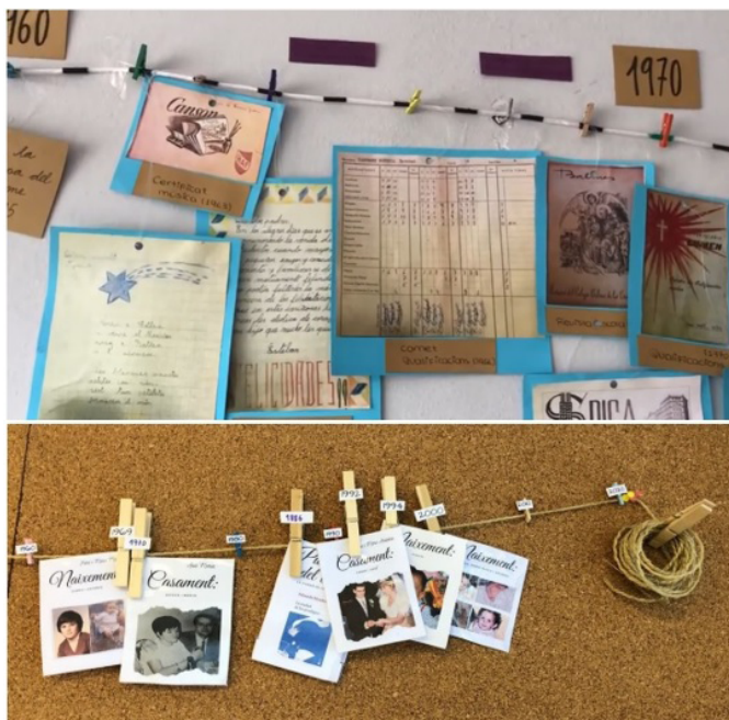
Figura 4. Ejemplos de líneas del tiempo.

Criach Singla, Q., Prat Moratonas, M. y Turró Amorós, M. (2022). Cuéntame la historia de tus abuelos: Ciencias Sociales, Matemáticas y Lengua en el grado de Educación Primaria. Didacticae , (11), 172-187. https://doi.org/10.1344/did.2022.11.172-187