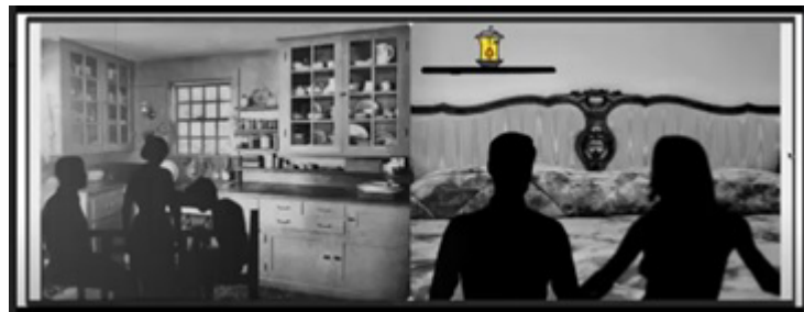
Figura 5. Ejemplo de ambientación de personajes con objetos.

Una vez contextualizada la narración, cada grupo de alumnos determina los personajes: los principales y secundarios, pero también concretan si aparecerá en su historia algún personaje antagonista. En muchas de las narraciones que crean los estudiantes los objetos seleccionados previamente se pueden considerar como auténticos personajes de la narración, y a menudo, comparten espacio y protagonismo con los personajes humanos que representan distintas generaciones y clases sociales.