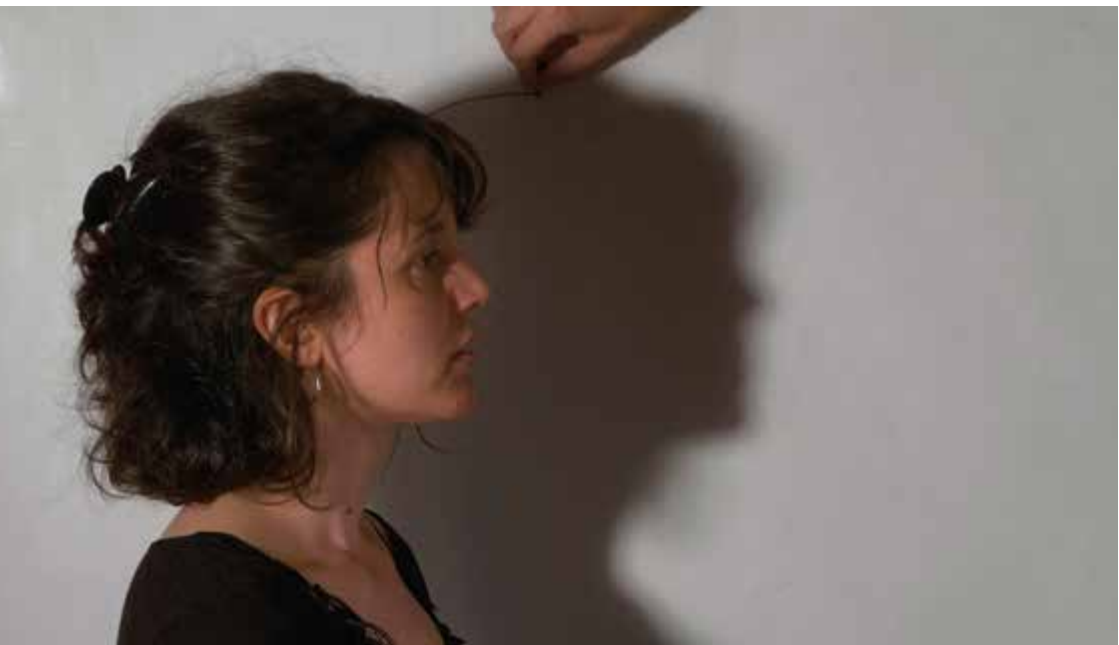
Fotograma d' El que encara ens balla

Encara no sabia, i trigaria molt a saber, que aquelles nits de diumenge serien per a mi com l'origen de les imatges, com aquell moment en què segons la llegenda, Dibutade va decidir capturar l'ombra del seu amant que es projectava a la paret, abans que aquest hagués de partir de viatge, tal com vaig provar de recollir a El que encara ens balla . Per a mi el cinema, també havia de partir d'una inspiració materna, havia de beure de la genealogia femenina.