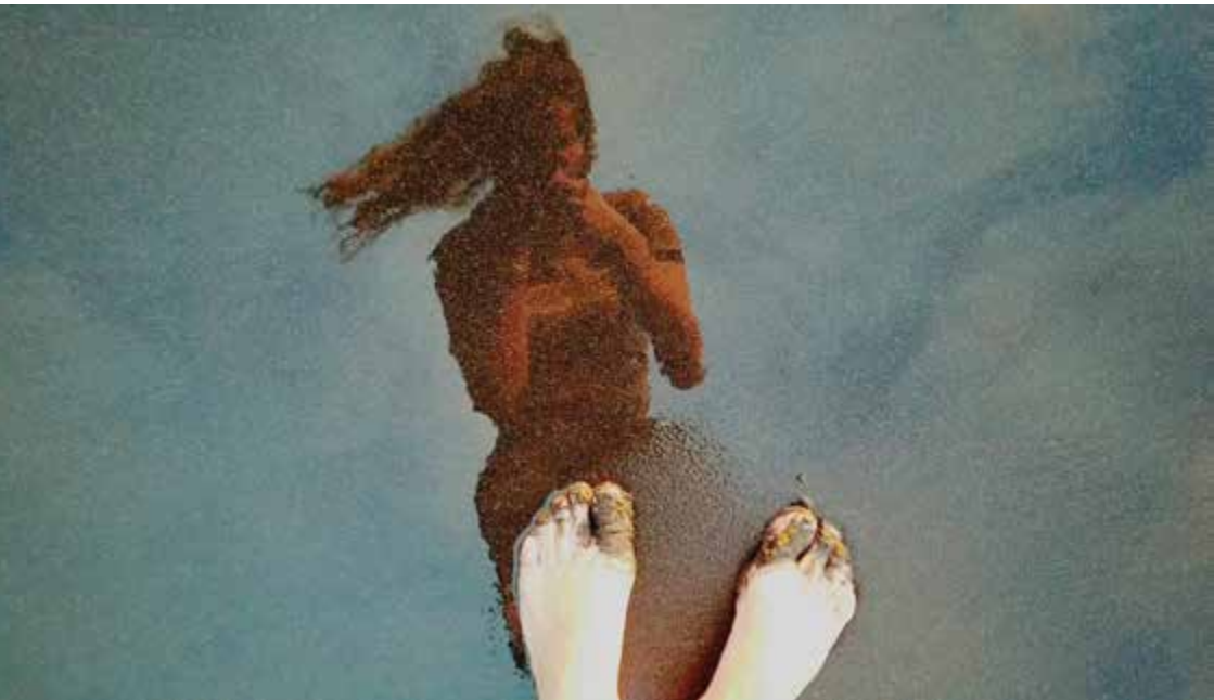
Fotograma d' El que encara ens balla

T'abraço, allargant els braços des de Barcelona fins a Roma, seguiré, com tu, insistint en l'exploració de les vivències personals, en les incerteses i en investigar dins i fora dels murs de la història.