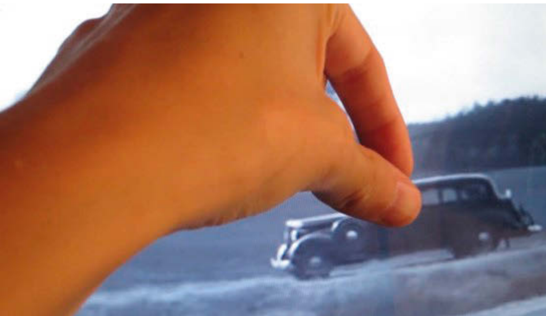
Fotograma d' Estimada (vida diària)

I gràcies també pel teu qüestionament incansable a la realitat i a la historiografia, per arriscar-te i per l'inconformisme, per fugir de les certeses i els llocs comuns i abraçar la incomoditat i l'atreviment. En aquest viatge no anem soles.