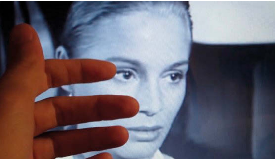
Fotograma d' Estimada (vida) diària

Així és com recordo que va entrar a la meua vida Bergman i sobretot algunes de les seves pel·lícules, que em van captivar per la poesia, profunditat i transcendència amb la que em semblava que capturaven la vida. Sé que Bergman va estar present en els teus primers contactes amb el cinema, a les sessions que programaves al cineclub de la teua joventut.