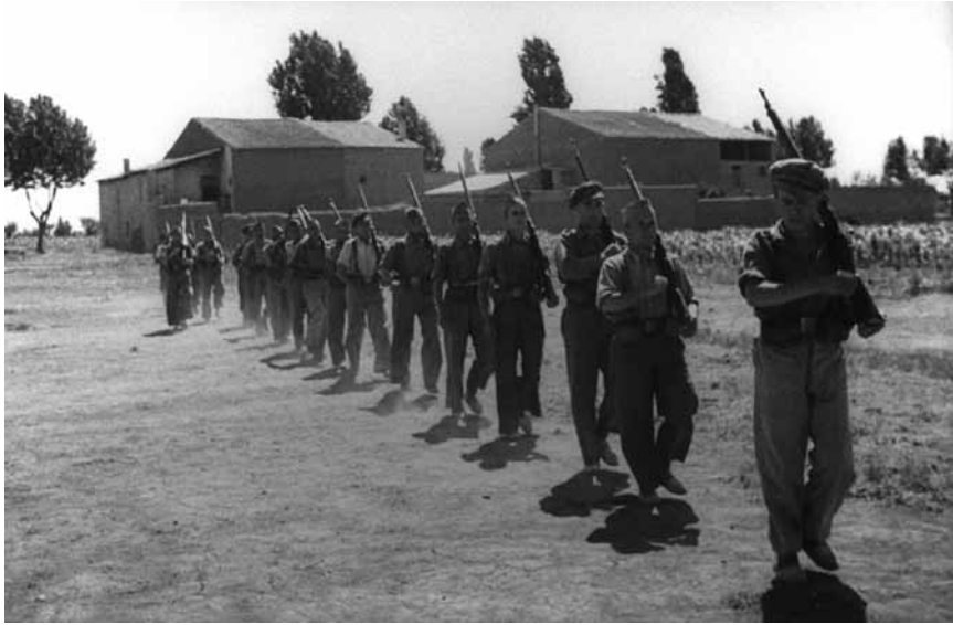
Maniobres de reclutes al camp d'instrucció de Termes (Lleida) (1937-39).