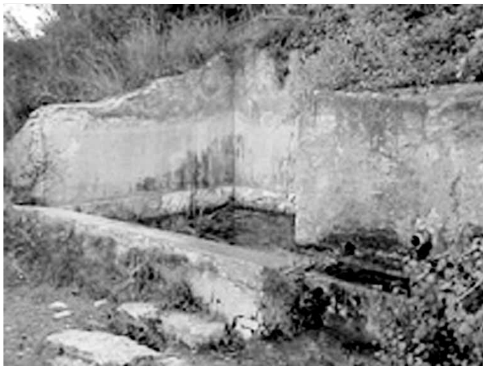
Fotografia 3. Safareig del camp d'instrucció.