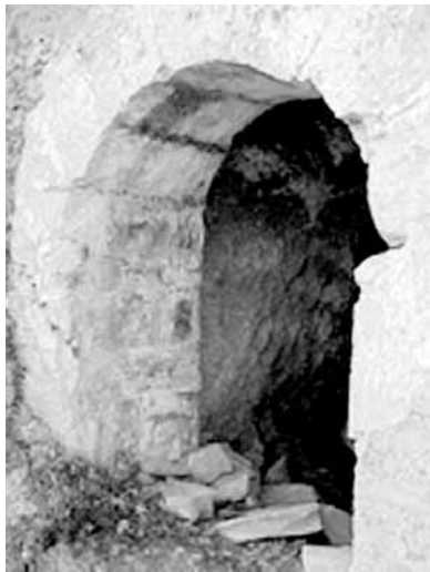
Fotografia 2. Entrada del polvorí.

Un dels barracons era més llarg i ample que la resta i en ell se celebraven actes de caire lúdic. Les estructures circulars s'aixecaven sobre un sòcol de pedra i tenien la teulada en forma de con. En la part alta de la muntanya, en el camp de conreu que actualment s'estén sobre el bosc, s'instal·laren les cuines.