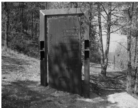
Foto 3: Porta d'entrada al museu del XVIIIè Cos d'Exèrcit Republicà a Pujalt.

El divuitè cos d'exèrcit, per exemple, les centralitzà a la població de Tàrraga, concretament a les Escoles Pies, i estava dirigida per Francesc Poca Baella 39 . D'aquesta manera la capital de la comarca de l'Urgell es convertí en l'epicentre de la tasca formativa de tota l'oficialitat del XVIIIè cos -tant dels oficials com dels suboficials (essencialment sergents i caporals)-, mentre que a Pujalt s'instruïa la tropa.