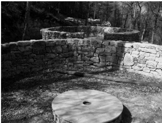
Foto 2: Actuals vestigis de les pedres que serviren al llarg de 1938 com a base de les tendes de campanya on s'allotjaven els joves reclutes de la base d'instrucció del XVIIIè Cos d'Exèrcit republicà a Pujalt (Anoia).

pueden estar orgullosos de los frutos de sus instituciones pedagógicas" 24 .